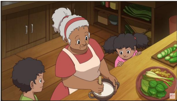
Gambar 3. Iklan Animasi Sasa

Tepung bumbu Sasa adalah salah satu jenis penyedap rasa yang telah dikenal luas dalam menciptakan cita rasa gurih dan lezat pada berbagai masakan. Pada tahun 2020, perusahaan ini meluncurkan kampanye iklan animasi 2D yang berjudul “Sasa Hadirkan Rasa untuk Indonesia”. Dengan durasi 2 menit 14 detik menggunakan gaya visual kartun, animasi ini mengangkat tema kehadiran Sasa yang meluas ke segala jenis masakan dan merambah ke seluruh penjuru Indonesia. Iklan animasi ini telah berhasil mencatatkan 8.150.709 x pemutaran dan 6.121 komentar (dilansir pada 14 Maret 2024). Tidak hanya menciptakan kehadiran yang signifikan di kalangan penonton, tetapi dengan adanya animasi ini juga memperkuat citra merek Sasa sebagai penyedia solusi penyedap rasa bagi berbagai masakan di Indonesia.