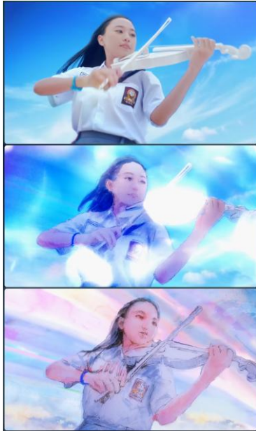
Gambar 7. Cuplikan Iklan Animasi Pocari Sweat