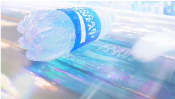
Gambar 5. Iklan Animasi Pocari Sweat (Rekam Layar platform Youtube, channel PocariID, 2024)

Pocari Sweat adalah merek minuman isotonik yang dapat menggantikan elektrolit yang hilang saat berkeringat dan menjaga tubuh tetap terhidrasi. Mereka sering membuat iklan animasi dan salah satu yang terpopuler adalah video “This is #BintangSMA 2019 Winner!” dengan durasi 1 menit. Walaupun video ini digarap sebagai pengumuman pemenang lomba yang Pocari Sweat adakan, isi dari video tersebut masih memperkenalkan produk mereka. Dengan memadukan animasi dan video nyata yang menampilkan sang pemenang sebagai aktornya, Pocari Sweat membawa pesan “Dengan satu langkah, satu tekad, satu keberanian akan membawamu ke perjalanan baru yang tidak terkira.” Membangun tekad penonton untuk berani mengambil langkah awal dan pantang menyerah seperti sang pemenang. Tidak hanya visual yang menakjubkan, animasi ini juga dilengkapi dengan musik biola yang dimainkan sang aktor. Animasi dari Pocari