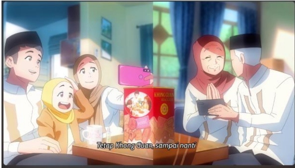
Gambar 1. Iklan Animasi Khong Guan (Rekam Layar platform Youtube, channel Khong Guan Biscuits Indonesia, 2024)

Khong Guan adalah merek biskuit asal Tiongkok, namun mereka juga memiliki iklan animasi 2D dari channel youtube Khong Guan Biscuits Indonesia di tahun 2020. Berjudul “Sebuah Kenangan Manis” dengan durasi 1 menit 21 detik Khong Guan menceritakan Ramadhan pada kala itu sedikit berbeda akibat PSBB, namun demi kebaikan bersama kita harus mencari cara untuk tetap bersilaturahmi yakni dengan video call dari tempat masing-masing. Walaupun terpisahkan oleh jarak, Khong Guan selalu ada untuk menemani tiap keluarga seperti Ramadhan di tahun-tahun sebelumnya. Digarap dengan gaya kartun, Iklan animasi ini berhasil mendapatkan 1.217.127 x pemutaran dan 2.044 komentar (dilansir pada 14 Maret 2024).