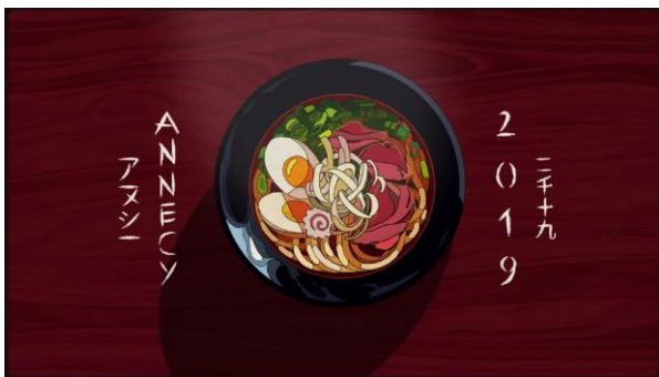
Gambar 8. Cuplikan Animasi Ramen oleh GOBELINS (Rekam Layar platform Youtube, channel GOBELINS PARIS, 2024)

Gobelins adalah sekolah seni dan desain di Paris, Prancis, yang secara khusus fokus pada pendidikan dalam bidang animasi, fotografi, dan multimedia. Gobelins terkenal karena banyak lulusannya yang sukses dalam industri animasi dan visual serta Gobelins menghasilkan beberapa film animasi dan karya seni visual terkemuka di dunia. Salah satu karyanya berjudul “Ramen” tahun 2019,