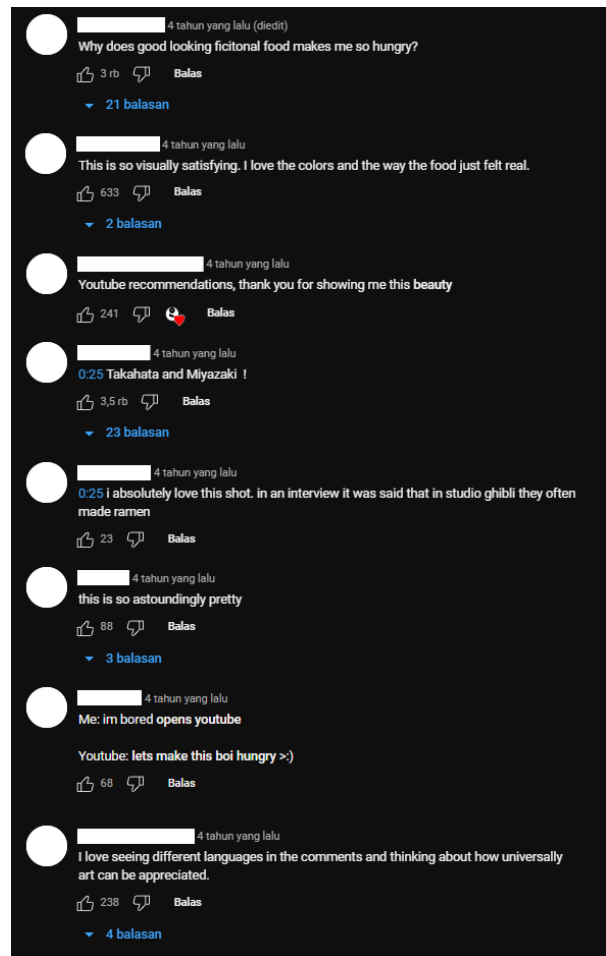
Gambar 9. Kolom Komentar Animasi Ramen oleh GOBELINS (Rekam Layar platform Youtube, channel GOBELINS PARIS, 2024)

dengan durasi 49 detik bercerita tentang ramen yang populer dimasak di dapur manapun seperti restoran, kedai, bahkan rumah. Animasi ini mendapatkan 643.449 x pemutaran dan 1.301 komentar (dilansir pada 14 Maret 2024).