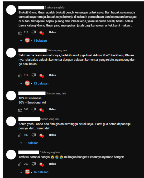
Gambar 2. Komentar teratas Iklan Animasi Khong Guan (Rekam Layar platform Youtube, channel Khong Guan Biscuits Indonesia, 2024)

Khong Guan adalah merek biskuit asal Tiongkok, namun mereka juga memiliki iklan animasi 2D dari channel youtube Khong Guan Biscuits Indonesia di tahun 2020. Berjudul “Sebuah Kenangan Manis” dengan durasi 1 menit 21 detik Khong Guan menceritakan Ramadhan pada kala itu sedikit berbeda akibat PSBB, namun demi kebaikan bersama kita harus mencari cara untuk tetap bersilaturahmi yakni dengan video call dari tempat masing-masing. Walaupun terpisahkan oleh jarak, Khong Guan selalu ada untuk menemani tiap keluarga seperti Ramadhan di tahun-tahun sebelumnya. Digarap dengan gaya kartun, Iklan animasi ini berhasil mendapatkan 1.217.127 x pemutaran dan 2.044 komentar (dilansir pada 14 Maret 2024).