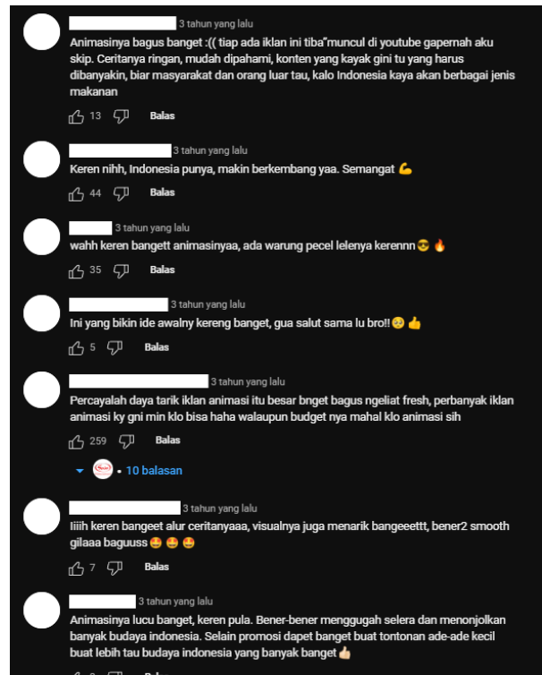
Gambar 4. Kolom Komentar Iklan Animasi Sasa (Rekam Layar platform Youtube, channel Sasa Melezatkan, 2024)

Tepung bumbu Sasa adalah salah satu jenis penyedap rasa yang telah dikenal luas dalam menciptakan cita rasa gurih dan lezat pada berbagai masakan. Pada tahun 2020, perusahaan ini meluncurkan kampanye iklan animasi 2D yang berjudul “Sasa Hadirkan Rasa untuk Indonesia”. Dengan durasi 2 menit 14 detik menggunakan gaya visual kartun, animasi ini mengangkat tema kehadiran Sasa yang meluas ke segala jenis masakan dan merambah ke seluruh penjuru Indonesia. Iklan animasi ini telah berhasil mencatatkan 8.150.709 x pemutaran dan 6.121 komentar (dilansir pada 14 Maret 2024). Tidak hanya menciptakan kehadiran yang signifikan di kalangan penonton, tetapi dengan adanya animasi ini juga memperkuat citra merek Sasa sebagai penyedia solusi penyedap rasa bagi berbagai masakan di Indonesia.