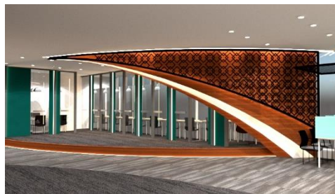
Gambar 11. gambar perspektif view 1 area membaca privat

Pada area ini juga menggunakan panel melengkung berlapis yang sama dengan area perpustakaan digital, pemasangannya yang saling berhadapan namun berbeda arah memberi kesan yang unik pada ruangan, menggunakan aksesoris finishing berwarna toska pada masing-masing sekat ruang membaca membuat suasana ruang menjadi lebih fun dan modern namun simple.