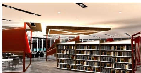
Gambar 6. gambar perspektif view 2 area koleksi dewasa