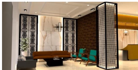
Gambar 3. gambar perspektif view 1 tunggu lobby

bermotif batuan travertine, selain itu terdapat sedikit ornament-ornamen yang diambil berdasarkan bentuk asli dari ornament khas betawi seperti pada panel samping resepsionis dan pada lisplang ceiling meja resepsionis yang diolah lagi menyesuaikan karakter dan bentuk pada ruang. Menggunakan temperature pencahayaan di sekitar 3000K agar menambah kesan hangat dan santai ditengah kesan yang elegan.