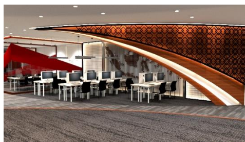
Gambar 10. gambar perspektif view 2 area digital