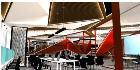
Gambar 8. gambar perspektif view 2 area membaca