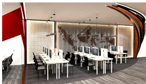
Gambar 9. gambar perspektif view 1 area digital

Pada area perpustakaan digital terdapat panel dinding pembatas area ruang dengan bentuk yang melengkung memberi kesan bermain dengan penyusunan panel yang berlapis membuat area ruang terlihat dinamis, selain itu di panel sisi lainnya terdapat hiasan dekoratif peta Indonesia yang ditutup dengan panel kombinasi plat stainless dan wiregrid memberi kesan yang kaku dengan garis-garis dan bentuk tajam yang dihasilkan.