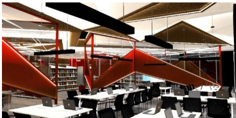
Gambar 7. gambar perspektif view 1 area membaca

dari bentuk ruang yang segitiga serta elemen dinding kaca dengan aksesoris bentuk diagonal memberi kesan dinamis namun kaku dan juga peletakannya yang diagonal.