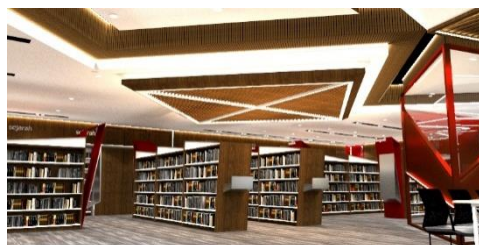
Gambar 5. gambar perspektif view 1 area koleksi dewasa

Area koleksi cukup memberi kesan tegas lewat bentuk-bentuk pada elemen ruang yang terkesan lurus dan tajam, juga pada pemilihan material yang didominasi penggunaan hpl yang bermotif kayu memberi kesan hangat. Namun untuk mengimbangi kesan kaku tersebut area membaca disini diimbangi dengan garis-garis yang miring untuk memberi kesan bermain, dapat dilihat pada bentuk furniture yang memiliki banyak elemen garis miring, serta penggunaan warna merah di beberapa elemen untuk menambah kesan bermain.