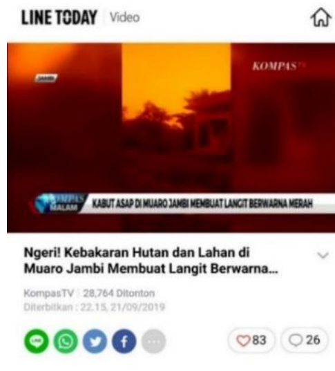
Gambar 2. Akun video dalam aplikasi chatting