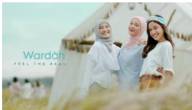
Gambar 1. Adegan Terakhir Iklan Wardah versi Feel The Beauty

Produk kecantikan merupakan produk yang dapat memenuhi kebutuhan perempuan akan kecantikan sekaligus menjadi sarana untuk memperjelas identitas dirinya di mata masyarakat. Banyak cara yang dapat digunakan perusahaan untuk memuaskan kebutuhan perempuan. Produk memang tidak dirancang untuk memenuhi kebutuhan fungsionalnya saja namun juga memenuhi kebutuhan sosial dan psikologi. Penulis akan membuat ringkasan temuan dari setiap adegan yang diakhiri dengan analisis deskriptif. Berdasarkan hasil penelitian, Wardah adalah sebuah produk kecantikan yang kurang lebih sudah 24 tahun berkembang di Indonesia. Produk ini menjadi pelengkap keseharian dalam merawat kulit sejak kosmetik Wardah pertama kali diluncurkan pada tahun 1995. Produk kecantikan ini selalu mengeluarkan inovasi baru. Tidak heran jika produk kecantikan ini selalu digemari oleh banyak perempuan. Pada awal tahun 2019, Wardah membuat iklan dengan tagline yang baru yaitu Feel The Beauty . Tagline sebelumnya yaitu Wardah Inspiring Beauty yang berubah menjadi Wardah Feel The Beauty . Iklan tersebut memberikan pesan tentang standar kecantikan untuk semua perempuan. Produk kecantikan sudah tidak asing lagi bagi perempuan terutama di Jakarta.