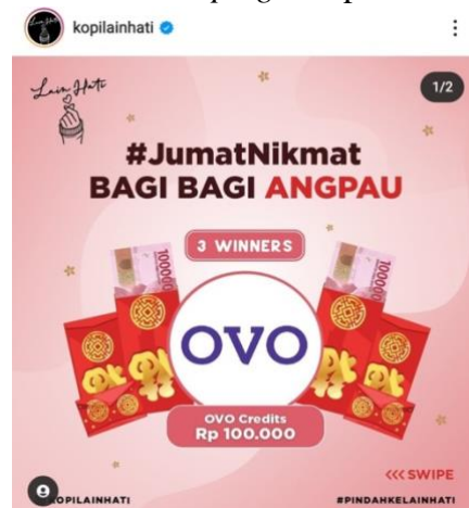
Gambar 2. Campaign Kopi Lain Hati

Pada Gambar 2 adalah salah satu contoh campaign yang telah dibuat Kopi Lain Hati, dimana Kopi Lain Hati mengadakan give away OVO dengan beberapa syarat dan ketentuan untuk para followersnya , dari kegiatan tersebut Kopi Lain Hati akan mendapatkan impact dari segi followers , aktivitas Instagram, dan dapat membangun brand awarenessnya .