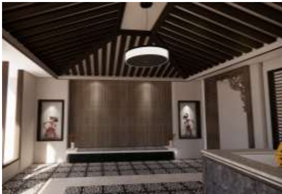
Gambar 2: Contoh lampu gantung pada Clinic Spa Martha Tilaar Gandaria

mempunyai unsur fungsional apapun dan hanya mempunyai unsur estetika sebagai daya tarik utamanya. Contohnya termasuk lampu gantung, lilin, dan perapian.