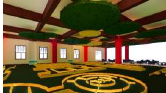
Gambar 8: Mini Golf

dan dan kuning memberikan kesan sejuk dan segar, ditambah dengan cahaya matahari yang masuk dari jendela.