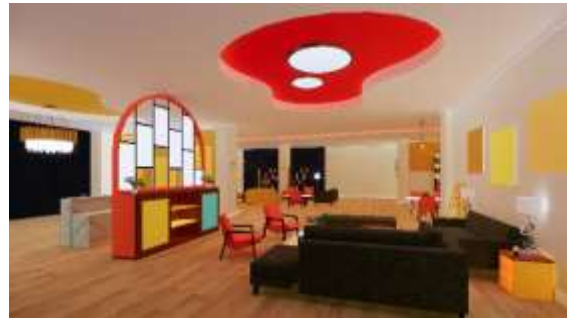
Gambar 5: Area Lounge 1

sekitar. Penggunaan furniture sofa dengan kapasitas duduk diharapkan dapat memberikan kenyamanan. Partisi belakang receptionist juga dimanfaatkan untuk dijadikan credenza.