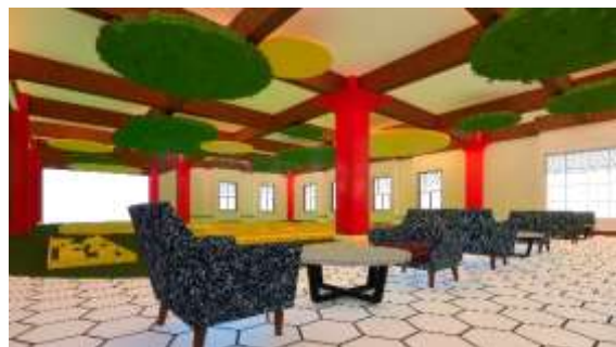
Gambar 9: Area Santai Mini Golf

Pada area mini golf juga terdapat area duduk bagi para pangunjung untuk dapat beristirahat. Pada area tersebut terdapat beberapa arm chair dengan corak berwarna biru dan putih. Warna yang digunakan cukup sederhana dikarena area tersebut sebagai objek untuk istirahat mata setelah melihat beberapa warna yang terdapat pada ruangan tersebut.