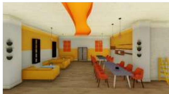
Gambar 6: Area Lounge 2

Setelah area lounge tersebut terdapat lounge yang dapat pengunjung nikmati untuk melakukan kesibukan lainnya, pada lounge tersebut terdapat meja meeting dan sofa. Pencahayaan pada area tersebut cukup hangat, ditambahkan beberapa hanging lamp agar pengunjung dapat nyaman melakukan kegiatannya. Fasilitas seperti cabinet dapat digunakan pengunjung yang memiliki member clubhouse.