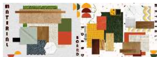
Gambar 3: Skema Bahan dan Material

Dari tema ini akan menggunakan gaya interior retro yang sesuai Pada Permata