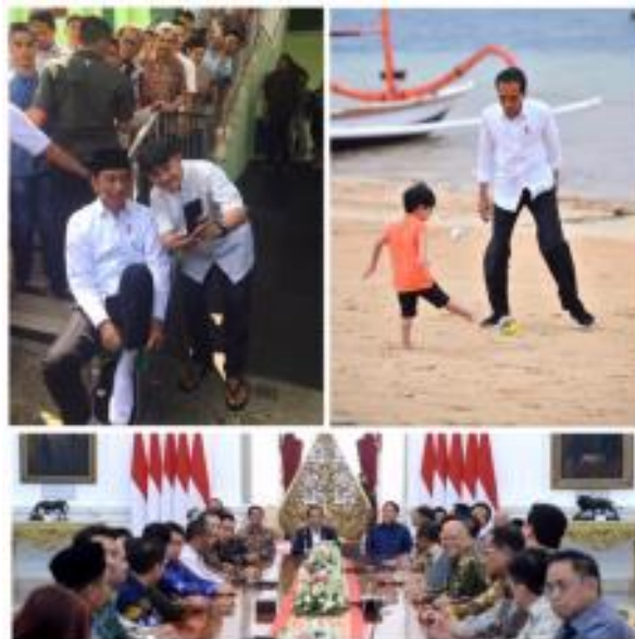
Gambar 1: Instagram Jokowi

Melalui Instagram Presiden Jokowi dapat dilihat bagaimana seorang Presiden Jokowi dalam citra dirinya di media sosial baik terhadap masyarakat, keluarga, maupun politik. Hal tersebut dapat dibuktikan melalui postingan Presiden Jokowi dari bulan Juni-Agustus 2019 yang menunjukkan citra dirinya terhadap keluarga sebanyak 18, politik sebanyak 78 dan masyarakat sebanyak 86 buah postingan yang ada didalam Instagram Jokowi. Beliau kerap membagikan setiap kegiatannya baik bersama keluarganya, bersama masyarakat sekitar dan juga urusan politiknya di berbagai Negara yang ada, beliau memperlihatkankannya melalui postingan Instagramnya.