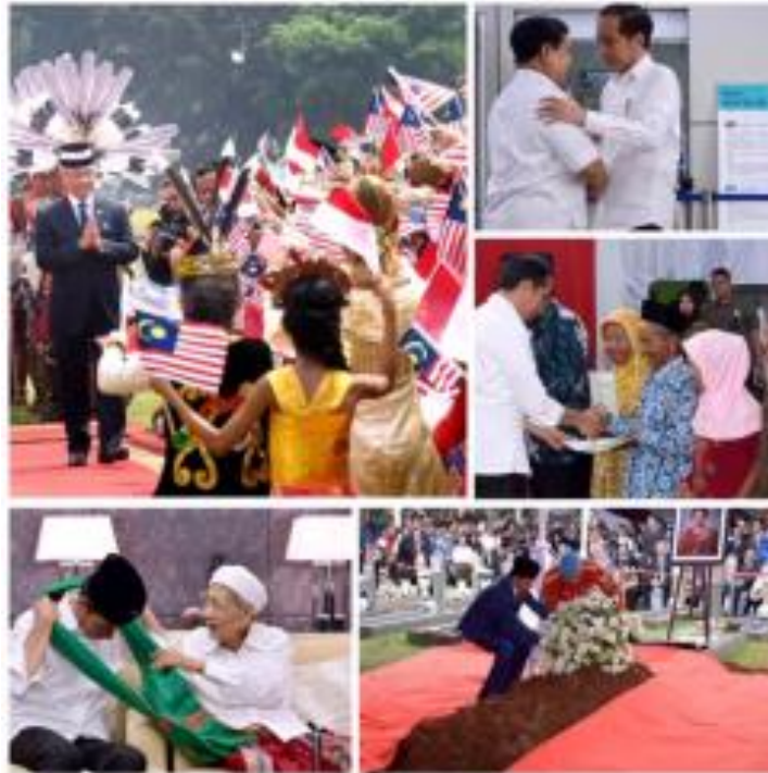
Gambar 2: Instagram Jokowi

Dalam setiap postingan yang Jokowi posting dalam Instagram beliau. Beliau sangat menunjukkan citra dirinya dalam setiap postingannya baik dalam sifat keterbukaan, empati, dukungan, bahkan sikap positifnya seperti yang beliau tunjukkan pada postingan beliau bersama Prabowo dan beliau sangat menunjukkan kepada setiap masyarakat, politik dan keluarga yang ada di setiap postingan Instagramnya.