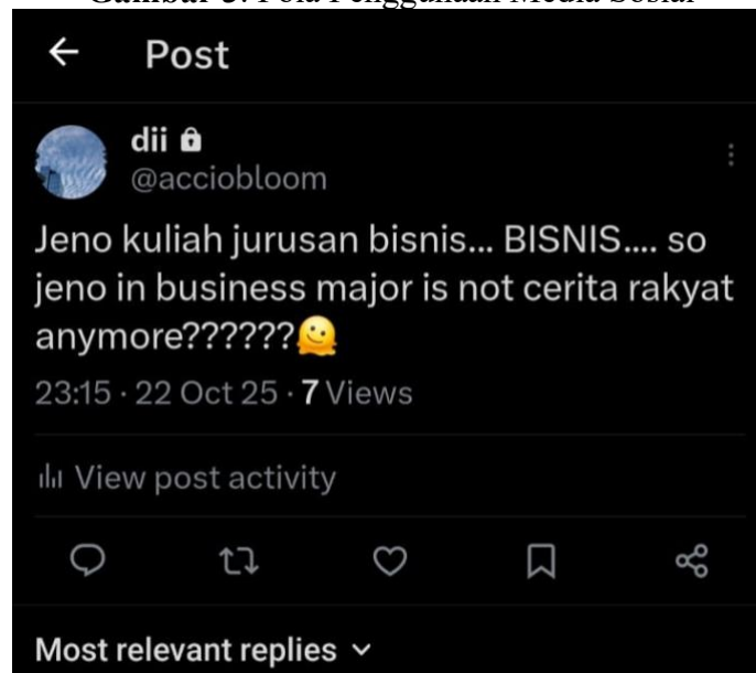
Gambar 3. Pola Penggunaan Media Sosial

Proses koordinasi ini diperjelas melalui kegiatan terstruktur di fanbase , sebagaimana tergambar dalam Gambar 3. Pola Penggunaan Media Sosial oleh @NCTDREAMIna Gambar tersebut memperlihatkan bagaimana fanbase mengorganisasi jadwal unggahan, thread penjelasan, panduan voting , dan aktivitas promosi secara sistematis (Ghufron et al., 2024). Bagi penggemar, pola terstruktur ini memudahkan partisipasi kolektif dan memperkuat rasa memiliki terhadap komunitas.