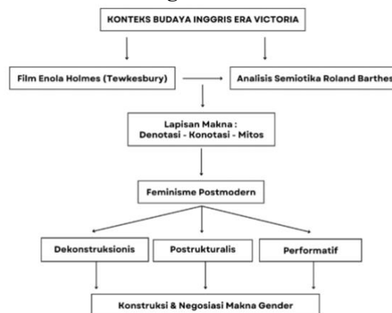
Gambar 1. Kerangka Pemikiran Penelitian

Kerangka berpikir penelitian ini berpijak pada latar sosial Inggris era Victoria yang kuat dengan nilai patriarki (Syahriyani & Novikasandra, 2022; Wahyuni, 2018). Dari konteks tersebut, film dibaca melalui tiga lapisan makna dalam semiotika Barthes: denotasi, konotasi, dan mitos untuk mengidentifikasi konstruksi gender yang tampil di layar. Hasil analisis kemudian ditafsirkan dengan tiga pendekatan feminisme postmodern: dekonstruksionis, poststrukturalis, dan performatif. Melalui alur berpikir ini, penelitian berupaya menunjukkan bagaimana representasi Tewkesbury menggambarkan maskulinitas yang lebih cair, empatik, dan terbuka terhadap perubahan sosial, sekaligus memperkaya kajian komunikasi dan representasi gender dalam sinema kontemporer.