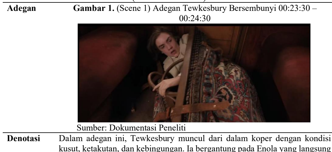
Tabel 1. Adegan yang Memperlihatkan Pembalikan Peran Gender (Dekonstruksionis)