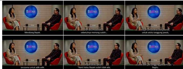
Tabel 2. Talk Show dan Kepanikan Keempat Anak