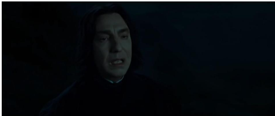
Gambar 5. Adegan 4, menit ke 1:17:51