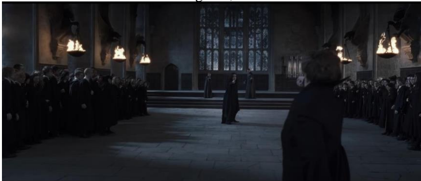
Gambar 2. Adegan 1, menit ke 37: 25

Dalam subbab ini peneliti akan menjabarkan analisis pengamatan menggunakan teori semiotika Charles yang memiliki 3 komponen dasar yaitu tanda, lambang dan isyarat. Berikut ini adalah beberapa adegan karakter Severus Snape yang merepresentasikan kepahlawanan beserta penjelasannya: