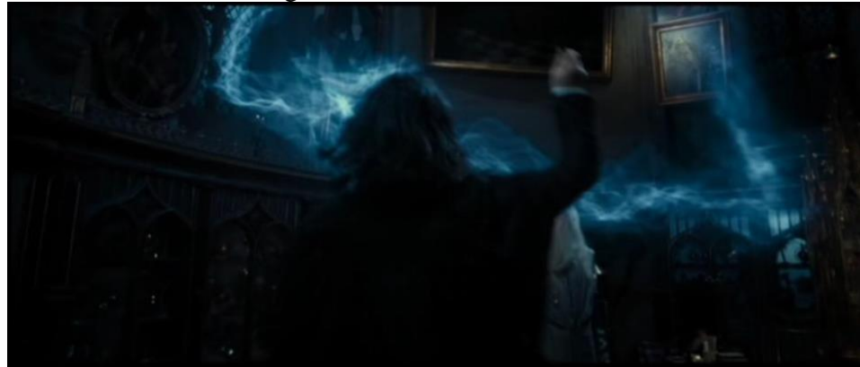
Gambar 6. Adegan 5, menit ke 1:22:14