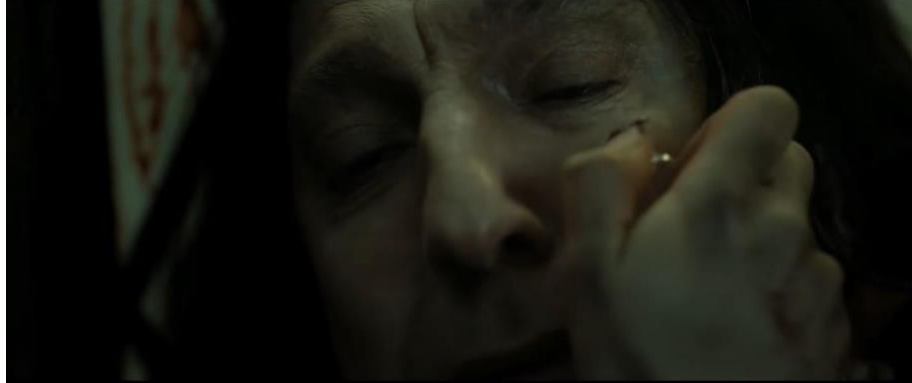
Gambar 4. Adegan 3, menit ke 1:10:41