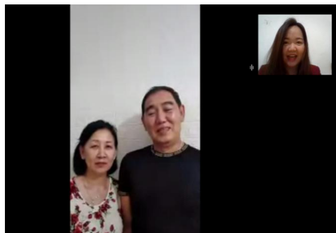
Gambar 3. Penulis Bersama Bapak AH dan Ibu LL

Sejak dulu peran serta status perempuan dalam masyarakat Tionghua memiliki posisi yang berbeda dengan laki-laki. Laki-laki ditempatkan dalam posisi utama atau pusat dari suatu keluarga. Oleh karena itu, keluarga Tionghua memiliki atau menganut sistem patriarki. Hal tersebut didukung dengan pandangan yang nyata dalam kehidupan seorang perempuan, bisa dilihat ketika seorang perempuan menikah dengan seorang laki-laki maka secara langsung perempuan juga akan ikut masuk dalam keluarga laki-laki yang dinikahnya tersebut.