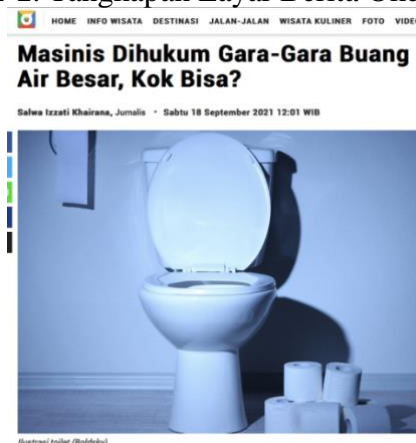
Gambar 1. Tangkapan Layar Berita Okezone.com