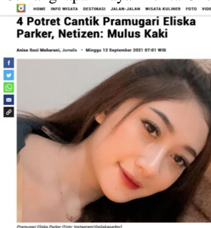
Gambar 3. Tangkapan Layar Berita Okezone.com

Kata “Pahanya Bening” tidak tunduk pada kaidah etika, karena bersifat tidak sopan dan memiliki maksud terselubung untuk menciptakan fantasi seksual khalayak pembaca. Judul berita tersebut dapat diganti dengan 4 Pose Pramugari Sherin Oviani bak Model Papan Atas . Kesalahan serupa juga ditemukan pada berita berjudul 4 Potret Cantik Pramugari Eliska Parker, Netizen: Mulus Kaki yang diterbitkan pada 12 September 2021. Kata “Mulus Kaki” tidak sesuai dengan kaidah etika, karena bersifat tidak sopan. Judul tersebut dapat diubah menjadi 4 Potret Cantik Pramugari Eliska Parker .