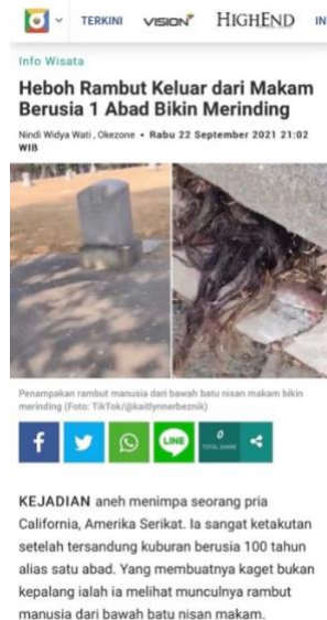
Gambar 4. Tangkapan Layar Berita Okezone.com

bukan kepalang ialah ia melihat rambut ...” Kalimat tersebut bersifat boros dan dapat disederhanakan dengan menghapus kata “alias satu abad” atau “100 tahun” serta mengganti kata “yang membuatnya kaget bukan kepalang” menjadi “pasalnya.” Kalimat lantas akan tertulis: “ia sangat ketakutan setelah tersandung kuburan berusia 100 tahun. Pasalnya, ia melihat rambut ...” atau “ia sangat ketakutan setelah tersandung kuburan berusia satu abad. Pasalnya, ia melihat rambut ...”