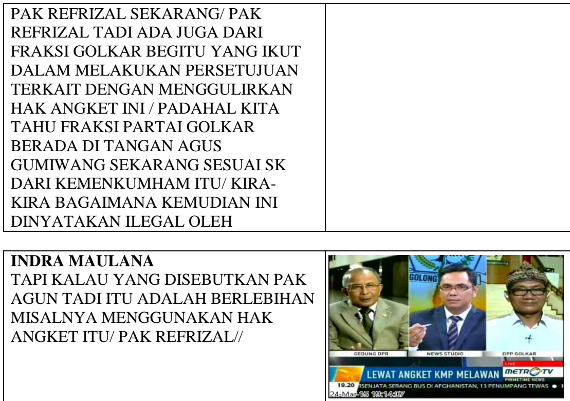
Tabel 2. Pola Kategorisasi Primetime News Metro TV 24 Maret 2015