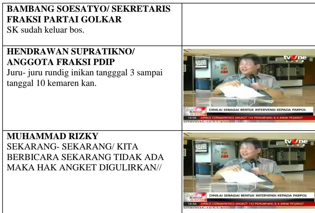
Tabel 3. Pola Kategorisasi Kabar Patang TVOne 24 Maret 2015