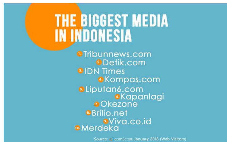
Gambar 2: Top 10 Online Media in Indonesia

Tribunjogja.com sendiri merupakan subdomain Tribunnews.com yang memiliki fokus untuk memberitakan peristiwa di suatu daerah tertentu. Media online tersebut berada di peringkat pertama dari 10 media daring yang paling banyak dikunjungi versi ComScore pada Januari 2018 (Portnoy, 2018). Dalam situs Alexa.com yang diakses bulan Juli 2019 (Topsites, 2019), Tribunnews.com berada di peringkat pertama situs-situs teratas di Indonesia. Selain itu, berada di peringkat kedua setelah Detik.com pada 500 situs teratas di situs dengan kategori World/BahasaIndonesia/Berita/Online . Dengan posisinya tersebut, Tribunjogja.com memiliki posisi strategis dalam memilihkan isu bagi pembacanya. Dengan demikian, makaperlu untuk mengetahui bagaimana Tribunjogja.com menyeleksi isu dan menonjolkan aspek-aspek dalam berita. Berdasarkan permasalahan tersebut, penelitian ini ingin melihat bagaimana Tribunjogja.com mengonstruksi dan membingkai isu sampah (Jogja Darurat Sampah) dalam kurun waktu Maret hingga April 2019.