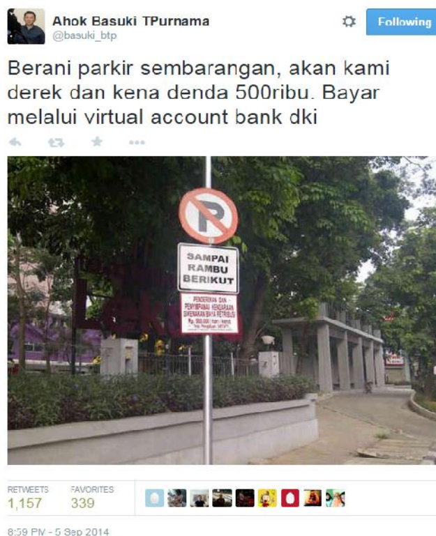
Gambar 3. Salah satu contoh tweet Basuki yang memiliki fungsi mempengaruhi

Tweet ini memiliki fungsi mempengaruhi karena dengan dengan dikomunikasikannya sanksi derek dan denda sebesar 500 ribu rupiah bagi yang parker sembarangan diharapkan dapat merubah sikap masyarakat untuk tidak parkir sembarangan lagi.