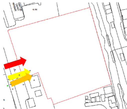
Gambar 2. Arah Pencapaian (Merah: pengunjung, Kuning: pengelola, Orange: servis)

Untuk servis seperti logistic, limbah, dan sebagainya, akses disediakan di sebelah timur tapak, karena lebar dan tinggi jalur masuk kendaraan lebih leluasa, juga tidak menjadi hambatan oleh padatnya para pengunjung, pemain, dan manajemen jika sedang ada acara.