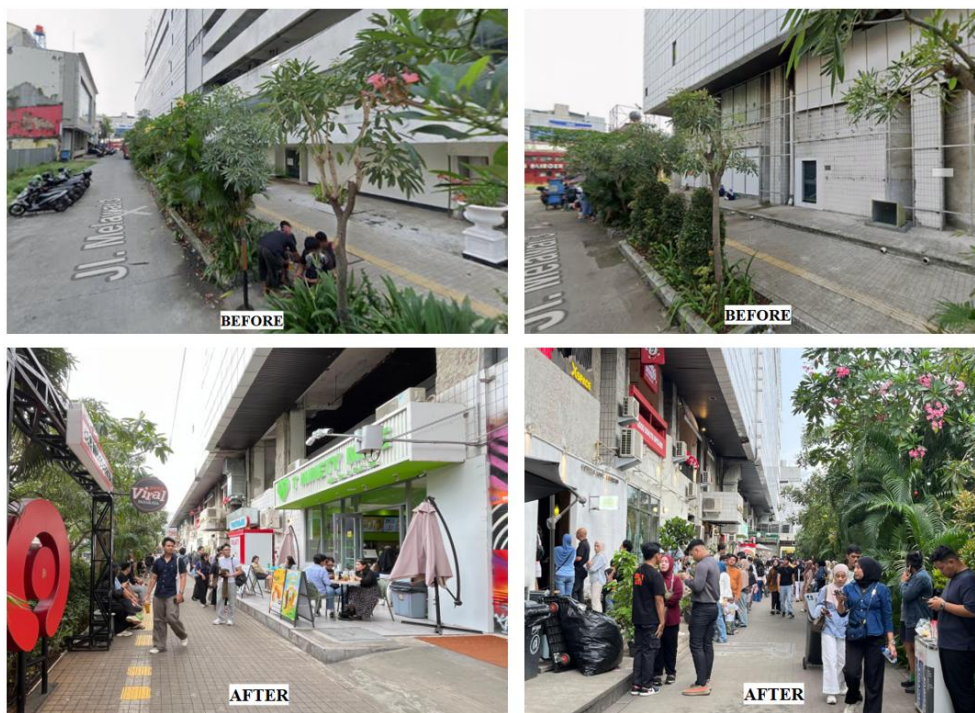
Gambar 3. Pasaraya Gang Viral Blok M Before dan After