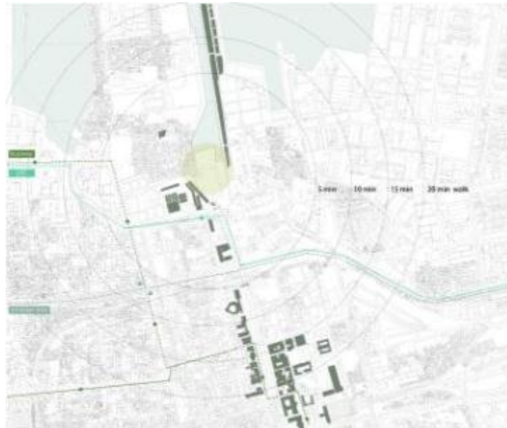
Gambar 3. Analisa Tapak terhadap Kawasan Kota Tua Sumber: Olahan penulis, 2018

Dari segi transportasi, transportasi umum di Jakarta terus berkembang dengan penambahan koridor Transjakarta, LRT dan MRT, yang beberapa diantaranya melewati kawasan Museum Bahari, sehingga tapak ini memiliki potensi untuk pengembangan ke depannya.