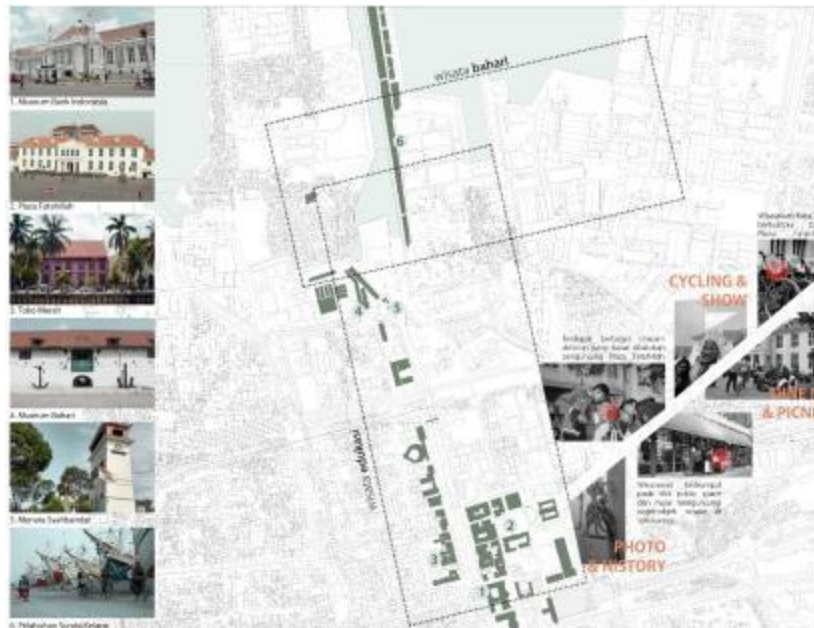
Gambar 2. Analisa Tapak terhadap Kawasan Kota Tua

Kawasan Pelabuhan Sunda Kelapa dan Museum Bahari besinggungan langsung dengan tema yang diangkat yaitu kelautan dalam bentuk edukasi dan informasi, sehingga kawasan ini dapat menjadi simpul keduanya yaitu wisata bahari dan wisata edukasi menurut lokasi dan programnya. Selain melihat potensi kawasan ini di mana Museum Bahari masih termasuk kawasan wisata Kota Tua, yaitu salah satu kawasan besar yang dikonservasi di Jakarta dan banyak dikunjungi wisatawan baik lokal dan mancanegara (terutama pada akhir pekan dan hari besar) karena beragam aktivitas maupun sejarah yang disuguhkan.