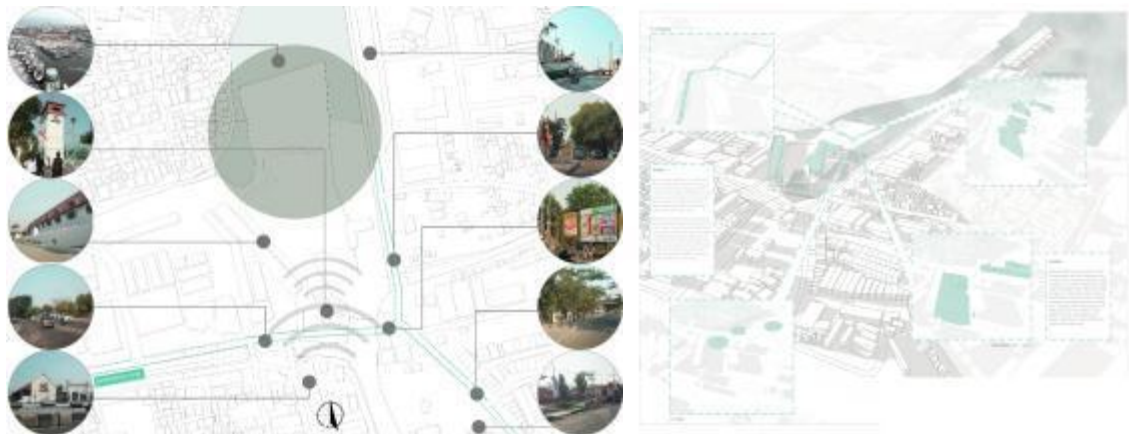
Gambar 4. Analisa Tapak

Tapak berada langsung pada rencana koridor LRT yaitu koridor Museum Bahari dan berjarak 450 meter dari Halte Transjakarta Pakin. Letak tapak juga dipinggir jalur tol dalam kota, yaitu 800 meter dari pintu keluar tol Sunda Kelapa, sehingga memudahkan mobilitas ke berbagai bagian kota di Jakarta.