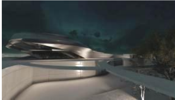
Gambar 6. Perspektif Eksterior – Underground Plaza Sumber: Olahan penulis, 2018

Kemudian saat berjalan turun bertemu dengan cafe . Suasana ruang pada Cafe ini memanfaatkan pasang surut air laut. Didepan cafe terdapat selasar dan jembatan apung untuk mendapatkan view dan suasana laut.