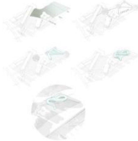
Gambar 5. Proses Pembentukan Gubahan Massa

Massa bangunan dibentuk berdasarkan titik view yang menjadi penting karena site dikelilingi oleh bangunan2 wisata. Terdapat 3 titik view yang dijadikan nodes sebagai public space . Titik pertama berada pada entrance yang berada diantara 2 bangunan bersejarah. Titik kedua berada pada tengah site dimana jika dielevasi titik ini dapat menjangkau semua objek di sekitarnya. Dan titik ketiga berada dipinggir laut yang berbatasan langsung dengan pelabuhan sunda kelapa. 3 titik ini dihubungkan lalu menjadi alur utama sirkulasi pengunjung. Massa bangunan dibuat menyatu dengan alur sirkulasi pengunjung ini.