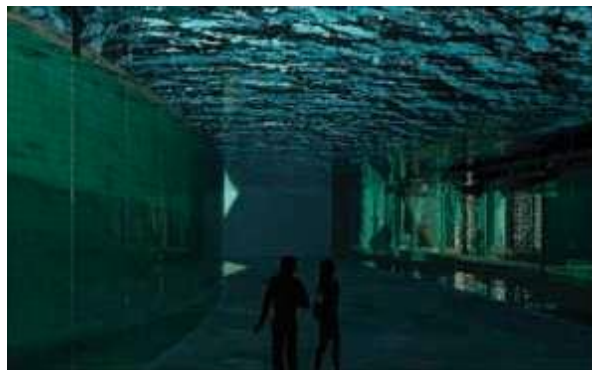
Gambar 7. Perspektif Interior – Lobby