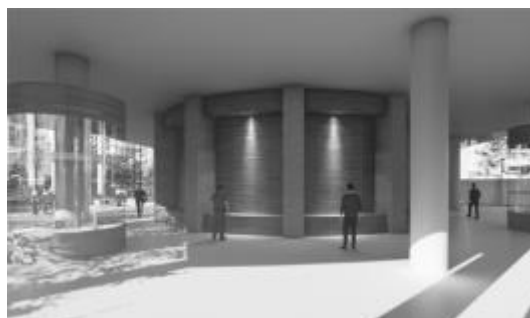
Gambar 5. Ruang Display