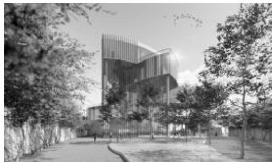
Gambar 4. Exterior

Setelah melalui berbagai tahap dalam proses pengembangan proyek hingga desain akhir, penulis mendapatkan beberapa kesimpulan dan saran akhir. Isu yang diangkat dan melatarbelakangi proyek ini merupakan suatu fenomena yang memerlukan sebuah solusi sebagai tempat atau wadah wisata olahraga bulutangkis. Melalui berbagai analisis dan studi, dapat disimpulkan bahwa bulutangkis di Indonesia perlu mendapat perhatian khusus dan perlu ada proyek yang pas untuk menangani masalah ini sehingga wisata olahraga di kota metropolitan dapat terwujud, bentuk, material, dan warna akan menggambarkan isi dari proyek itu sendiri sehingga perlu diperhatikan dalam proses desain. Lingkungan sekitar sangat mempengaruhi tapak dan hasil desain sehingga perlu mendapat tanggapan desain. Proyek ini dapat menjadi ikon baru bagi kota Jakarta karena belum ada sebelumnya sehingga dapat menarik wisatawan untuk berwisata dan menjadi wajah baru bagi kota metropolitan Jakarta.