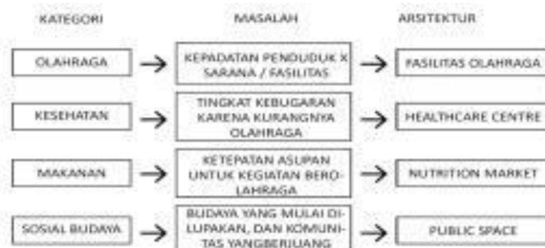
Gambar 2. Skema pemikiran

Kegiatan yang ada di tapak merupakan program campuran yaitu olahraga yang dibungkus dengan rekreasi. Program yang ditawarkan merupakan gabungan antara olahraga dengan wisata sehingga berbeda dengan sport hall atau yang dikenal dengan gelanggang olahraga. Adapun Program yang ditawarkan berbeda dengan gelanggang olahraga pada umumnya, seperti virtual badminton , technical badminton , legend vision , learning experience , hall of fame , gallery dan penunjang lainnya.