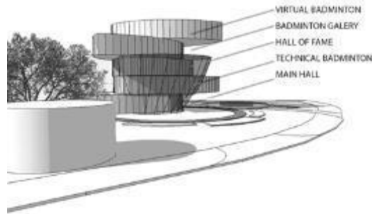
Gambar 3. Massa Bangunan