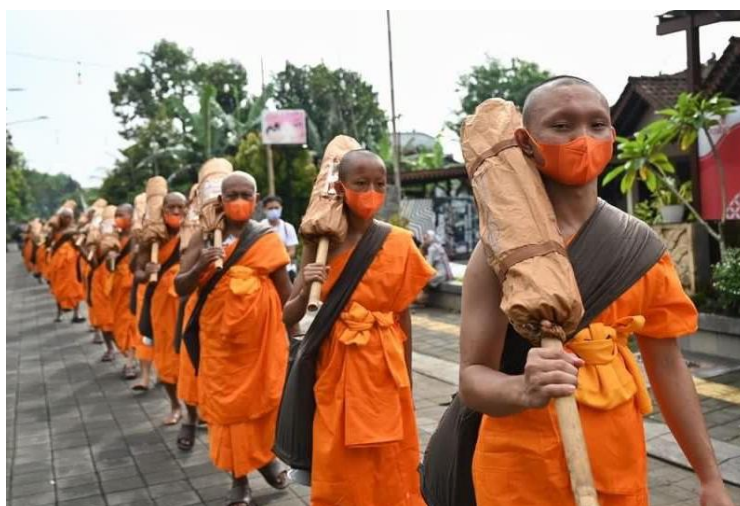
Gambar 2. Thudong Dhammayatra Pabbajja Samanera MBMI 2022