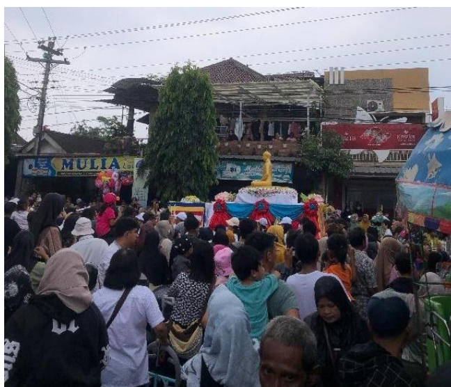
Gambar 4. Prosesi Kirab Waisak 2024