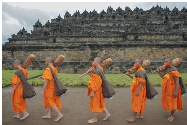
Gambar 3. Thudong Dhammayatra Pabbajja Samanera MBMI 2022