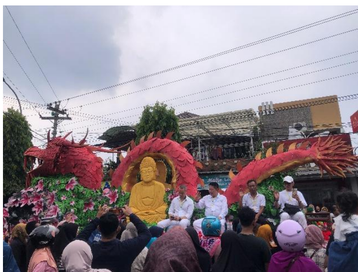
Gambar 5. Prosesi Kirab Waisak 2024 Sumber: Dokumentasi Penulis, 2024