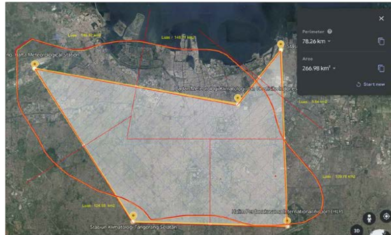
Gambar 2 Hasil Analisis Poligon Thiessen