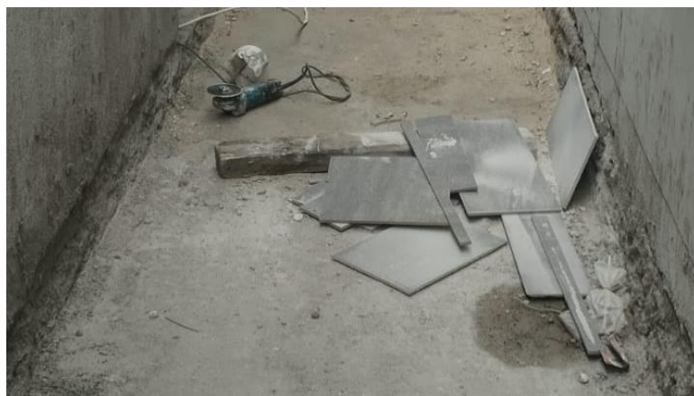
Gambar 2. Gambaran waste keramik