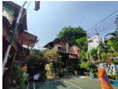
Gambar 2. Foto Kondisi Kampung Leuser Saat Ini

Kampung Leuser merupakan sebuah kampung yang terletak di Jl. Leuser, tepatnya di RT005, 006, 007, 008, 010, RW 08, Kelurahan Gunung, Kecamatan Kebayoran Baru, Jakarta Selatan. Kampung Leuser memiliki luas kurang lebih 1,1 Hektar. Saat ini (2019) Kampung Leuser dihuni oleh sekitar 100 KK, dengan 80 KK terdaftar dan tinggal di tempat, dan 20 KK terdaftar dan tidak tinggal di tempat. Jumlah warga yang terdaftar dan tinggal di tempat adalah 309 jiwa, dengan 203 penduduk terdaftar dan 106 pengontrak terdaftar. Kampung Leuser sendiri merupakan permukiman padat penghuni dan menempati tanah milik PAM Jaya, yang berdasarkan rencana kota Kebayoran Baru tahun 1948 dan RTRW 2010 merupakan jalur hijau dengan fungsi awal sebagai RTH.