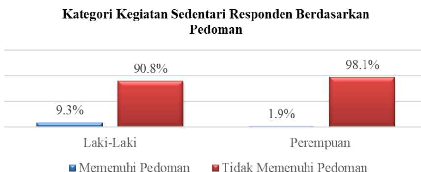
Gambar 2. Kategori Kegiatan Sedentari Responden Berdasarkan Pedoman

Untuk durasi tidur, kebanyakan responden memiliki durasi tidur < 8 jam (tabel 4). Didapatkan siswi lebih banyak dengan durasi tidur < 8 jam daripada siswa. Hasil penelitian ini sesuai dengan penelitian terhadap remaja di Korea (Yoo & Kim, 2020). Didapatkan juga total siswa-siswi