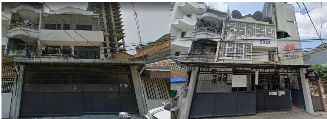
Gambar 1. Perubahan Fungsi Hunian ke Komersial (foto sebelah kiri di tahun 2013, foto sebelah kanan di tahun 2019)

teratur, yang berada di dalam kantong-kantong kota (Handrianto, 1996). Glodok merupakan salah satu daerah yang mengalami perubahan fungsi permukiman. Perubahan ini berada di pinggir jalan dan dekat dengan pusat kegiatan, sehingga pola yang ada mengikuti jalur transportasi untuk menuju daerah-daerah tertentu. Perubahan ini dimulai dari tahun 1980an. Perubahan fungsi komersial pada kawasan permukiman tentunya akan menambah kompleks masalah yang saat ini tengah dihadapi oleh pemerintah DKI Jakarta terkait penyediaan tempat tinggal yang layak bagi penduduk di wilayah perkotaan karena komersialisasi pada kawasan permukiman berpotensi menghilangkan kawasan permukiman itu sendiri dan juga mengakibatkan fungsi kota yang semakin tidak terstruktur karena tidak sesuai dengan tata ruang wilayah yang telah direncanakan sebelumnya.