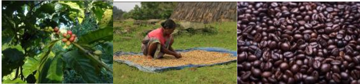
Gambar 1. Proses pengolahan secara sederhana dengan jemur manual (tengah) untuk mengolah biji kopi (kiri); dilanjutkan dengan proses sangrai untuk menghasilkan biji kopi sangrai (kanan)

Kawasan perkebunan jambu mete di Kabupaten Manggarai Barat tersebar di 3(tiga) kecamatan, yaitu: Kecamatan Lembor Selatan, Sano Nggoang, dan Lembor. Kecamatan Lembor Selatan, selain memiliki kawasan kebun jambu mete terluas juga menghasilkan produksi mete terbesar, yaitu sebanyak 623ton atau 40% dari total produksi di Kabupaten Manggarai Barat, disusul