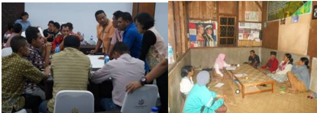
Gambar 3. Proses diskusi dengan pelaku dan masyarakat (kiri) serta kelompok petani di Manggarai Barat

Pengembangan destinasi pariwisata di Labuan Bajo merupakan bagian dari program prioritas Kementerian Pariwisata, karena Labuan Bajo adalah salah satu dari 10 (sepuluh) Destinasi Pariwisata Prioritas (DPP), yaitu: (1) Danau Toba (Sumatera Utara), (2) Tanjung Kelayang (Bangka Belitung), (3) Tanjung Lesung (Banten), (4) Kepulauan Seribu (DKI Jakarta), (5) Borobudur (Jawa Tengah), (6) Bromo Tengger Semeru (Jawa Timur), (7) Labuan Bajo (Nusa Tenggara Timur), (8) Wakatobi (Sulawesi Tenggara), (9) Morotai (Maluku), (10) Mandalika (Nusa Tenggara Barat). Labuan Bajo sebagai destinasi pariwisata juga mendapat manfaat dari adanya percepatan pengembangan aksesibilitas menuju destinasi pariwisata melalui 3(tiga) pintu masuk utama, yaitu Jakarta, Bali, dan Batam. Bali merupakan hub utama bagi Flores, khususnya bagi Labuan Bajo karena konektivitas jalur penerbangan ke Labuan Bajo seluruhnya melalui bandara internasional Ngurah Rai di Denpasar, Bali.