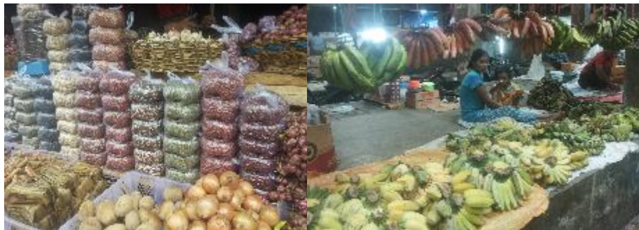
Gambar 2. Berbagai jenis hasil produk pertanian (beras, jagung, dan kacang-kacangan) serta berbagai jenis pisang yang dapat ditemukan di pasar Labuan Bajo

Data sekunder terkait produk tanaman sayur dan buah di Kabupaten Manggarai Barat sangat minim untuk menjadi dasar kajian, oleh karena itu kajian akan menggunakan data primer hasil wawancara dengan kelompok petani.