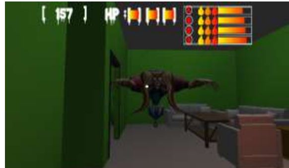
Gambar 5 Tampilan Gameplay

dan controller joystick sudah dapat digunakan. Lilin dan semua tipe jumpscare dapat berinteraksi dengan pemain dan berjalan dengan baik. Enemy patrol sudah dapat berkeliaran pada stage, jika pemain masuk kedalam jarak pandang enemy patrol dan nyawa berkurang juga sudah berjalan dengan baik.