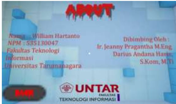
Gambar 4 Tampilan modul About

Modul about ini menampilkan informasi tentang pembuat game . Informasi tersebut berisi nama, NIM, program studi, dan fakultas pembuat beserta nama dosen pembimbing. Tampilan modul mulai dapat dilihat pada Gambar 4 .