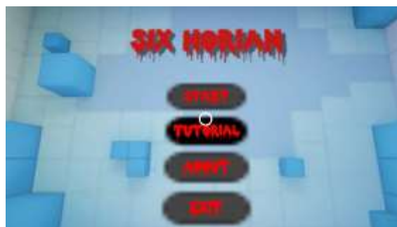
Gambar 2 Tampilan menu utama

Tampilan menu utama dapat dilihat pada Gambar 2 .