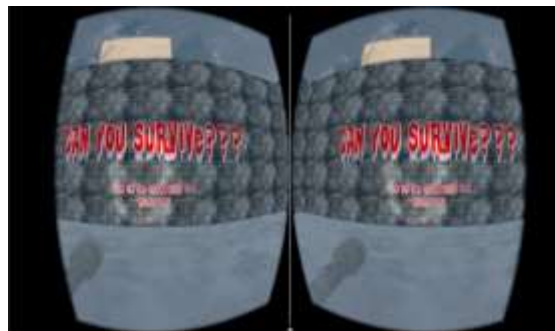
Gambar 1 Tampilan game Can You Survive?[1]

Contoh game yang pernah dibuat sebelumnya adalah Can You Survive? . Game Can You Survive? merupakan game virtual reality yang dirancang oleh Harry Sugianto. Game “Can You Survive?” merupakan sebuah game dengan fitur virtual reality yang memiliki genre survival horror . Game ini memiliki sudut pandang karakter orang pertama. Player berperan sebagai karakter utama yang terjebak dalam labirin. Player ditugaskan untuk mencari jalan keluar dari labirin tersebut. Terdapat beberapa petunjuk yang diletakkan di dalam labirin yang dapat menuntun para player untuk menemukan jalan keluar. Game ini memiliki tiga jenis labirin yang dapat dimainkan dan setiap labirin memiliki dua stage dengan bentuk labirin dan petunjuk yang berbeda. Tampilan permainan dapat dilihat pada Gambar 1[1].