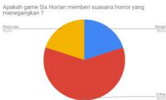
Gambar 6 Persentase suasana horror yang menegangkan