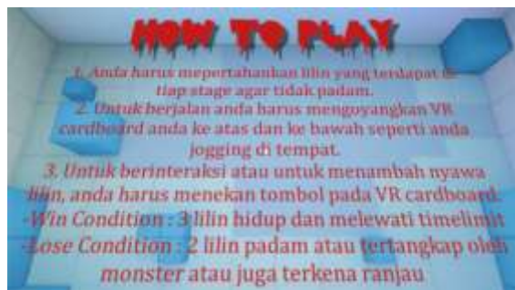
Gambar 3 Tampilan modul Tutorial

Modul tutorial berfungsi untuk menampilkan gambar yang berisi tulisan untuk dibaca pemain terlebih dahulu sebelum bermain supaya pemain dapat mengetahui hal-hal dasar dalam game . Modul menu tutorial dapat dilihat pada Gambar 3 .