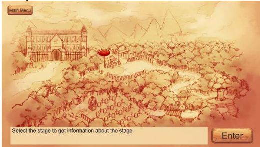
Gambar 2 Tampilan Modul Select Stage

Select Stage muncul setelah pemain memilih untuk memlai game dari awal atau melanjutkan game yang sudah dimainkan. Pada modul ini pemain dapat memilih stage yang ingin dimainkan atau kembali ke modul start menu . Tampilan modul select stage dapat dilihat pada Gambar 2 .