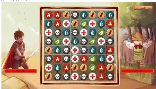
Gambar 3 Tampilan Modul Permainan

Modul permainan muncul setelah pemain memilih stage yang akan dimainkan. Pada modul ini pemain akan melakukan pertarungan dengan musuh. Musuh yang dilawan oleh pemain beragam tergantung pada stage yang dipilih oleh pemain. Pertarungan dilakukan dengan sistem real-time yaitu pemain akan menyerang musuh saat pemain berhasil mencocokkan keping puzzle dan musuh akan terus menyerang sesuai speed musuh sampai salah satu pihak kehabisan health point . Tampilan modul permainan dapat dilihat pada Gambar 3 .