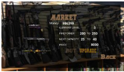
Gambar 5 Modul Market