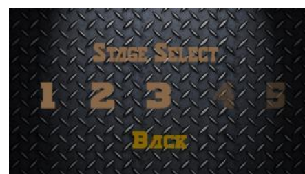
Gambar 4 Modul Level Select