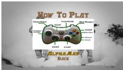
Gambar 6 Modul How To Play