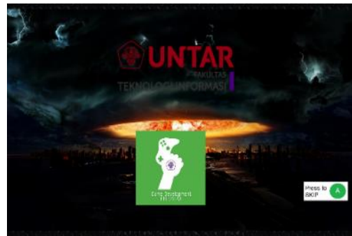
Gambar 10 Modul Ending