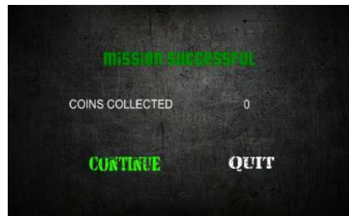
Gambar 12 Modul Mission Success