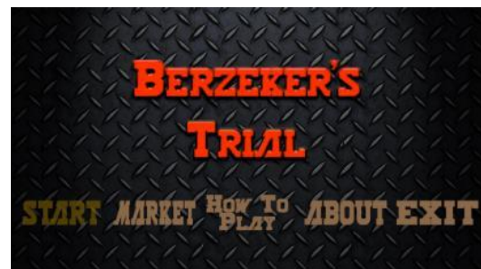
Gambar 2 Modul Home