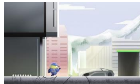
Gambar 1 Game Beyond

Oleh karena itu dibuatlah sebuah permainan yang dapat dimainkan lebih dari satu pemain menggunakan engine Unity 3D, permainan tersebut bernama “Berzeker’s Trial”. Berzeker’s Trial merupakan sebuah permainan dua dimensi yang dirancang dapat dimainkan sendiri maupun bersama dengan teman/saudara pada perangkat yang sama. Berzeker’s Trial sendiri memiliki artian petualangan dari prajurit-prajurit terpilih. Di dalam permainan pemain mengendalikan prajurit yang bertugas untuk menumpas musuh-musuh yang ada di dalam game dan menghindari jebakan-jebakan berbahaya. Contoh game yang pernah dibuat adalah Beyond dan dapat dilihat pada Gambar 1 [7].