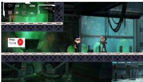
Gambar 7 Modul Alpha Map