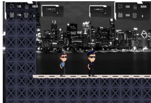
Gambar 11 Modul Permainan