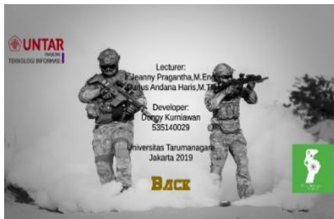
Gambar 8 Modul About