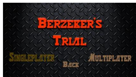
Gambar 3 Modul Selector