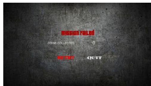
Gambar 13 Modul Mission Failed