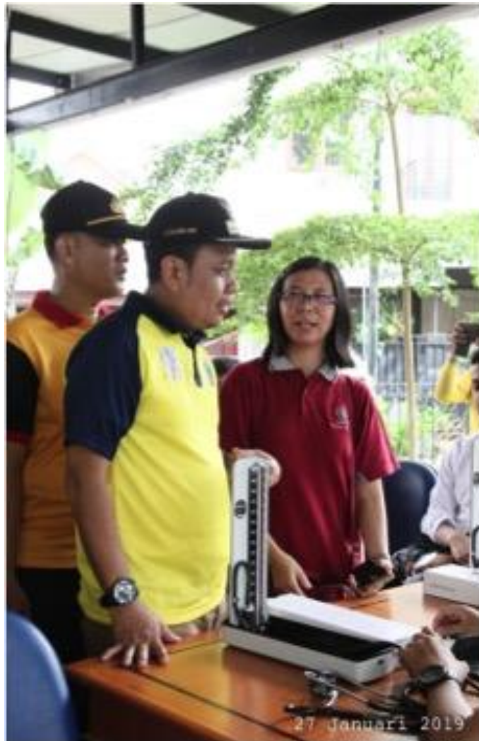
Gambar 2. Dokumentasi Kegiatan (1)

Pada kegiatan ini, lebih dari separuh peserta yang menghadiri kegiatan berjenis kelamin perempuan (81,9%). Lebih dari tujuh puluh lima persen warga yang hadir berusia di atas 40 tahun; sebanyak 27,7% diantaranya sudah berusia lebih dari 60 tahun. Diketahui usia termuda warga yang menghadiri kegiatan adalah 14 tahun, dan usia tertua warga yang menghadiri adalah 78 tahun. Penyakit tidak menular dapat terjadi pada semua golongan usia, baik di negara maju maupun negara berkembang. Data dari WHO menunjukkan bahwa 15 juta kematian akibat PTM terjadi pada rentang usia 30 sampai 69 tahun. Lebih dari 85% kematian tersebut terjadi di negara berpendapatan rendah hingga menengah. (WHO, 2014) Didapatkan 44,6% warga yang memiliki anak lebih dari 2 orang. Sebanyak 65,1% warga diketahui menamatkan pendidikan hingga sekolah menengah atas.