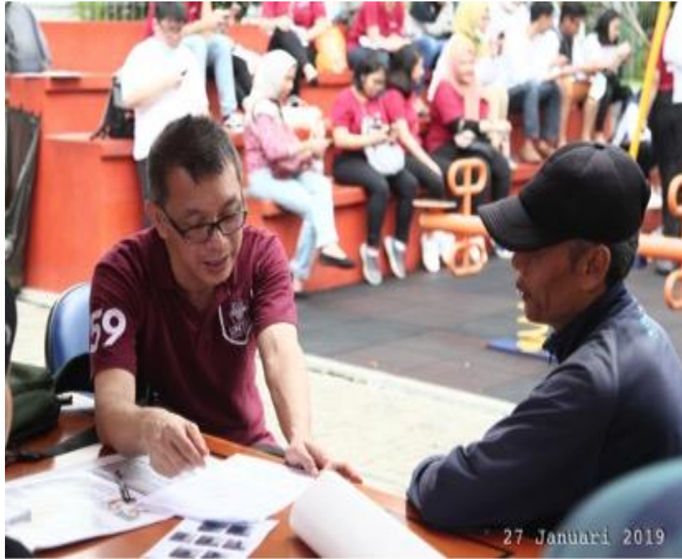
Gambar 5. Dokumentasi Kegiatan (4)

Dari delapan puluh tiga warga, didapatkan hanya 10,8% warga yang tekanan darahnya tinggi (hipertensi), gula darah sewaktu (GDS) tinggi ( >200 mg/dL) 4,8%, kolesterol tinggi ( >200 mg/dL) 16,9%, dan asam urat tinggi (laki-laki >7 mg/dL; perempuan >6 mg/dL) 25,3%. Dibandingkan dengan hasil Riskesdas 2018, prevalensi Hipertensi berdasarkan pengukuran di Kelurahan Tomang didapatkan lebih rendah. Sedangkan untuk prevalensi DM, prevalensi di Kelurahan Tomang didapatkan lebih tinggi dibandingkan dengan hasil Riskesdas. (Kementerian Badan Penelitian dan Pengembangan Kesehatan, 2018) Pada kegiatan pengabdian ini tidak dilakukan pendataan terhadap asupan makanan dan pola makan dari peserta. Berdasarkan hal tersebut, perlu dilakukan suatu penelitian untuk mengetahui faktor-faktor resiko tingginya prevalensinya DM di kelurahan Tomang.