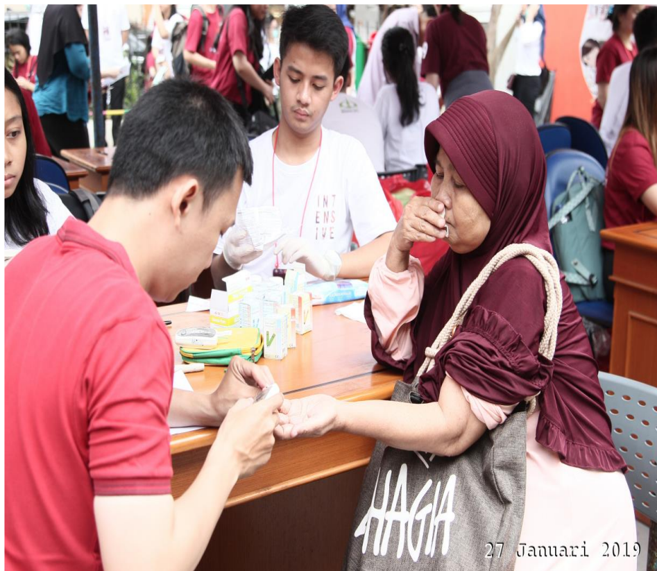
Gambar 4. Dokumentasi Kegiatan (3)