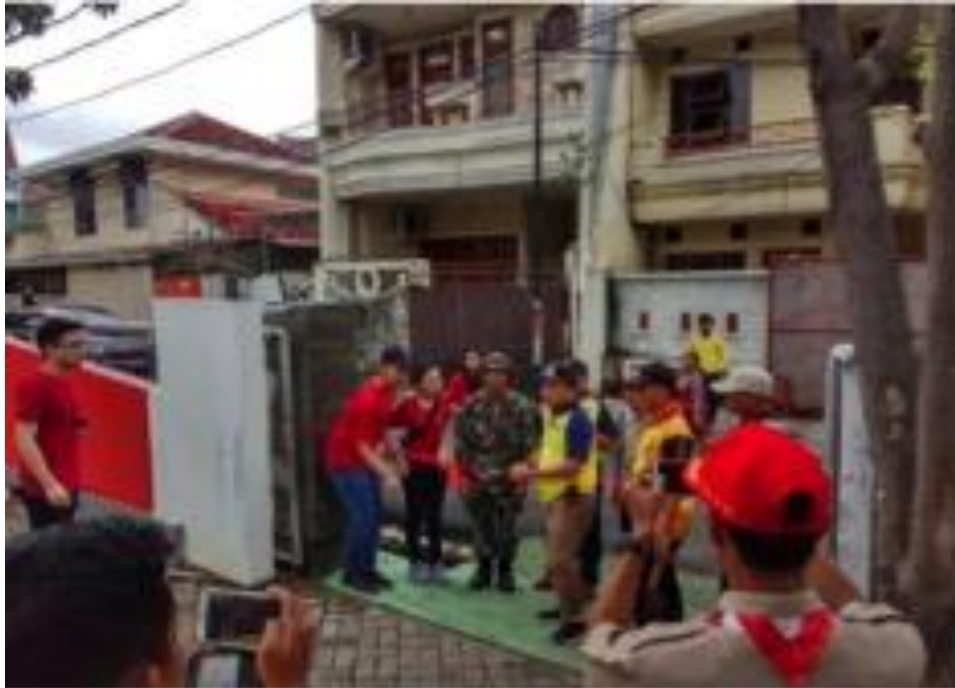
Gambar 3. Dokumentasi Kegiatan (2)