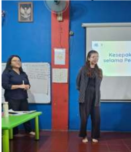
Peneliti membuka sesi pelatihan

Pelatihan yang dilaksanakan bertujuan untuk meningkatkan pengetahuan guru terhadap variasi media pembelajaran dan komunikasi asertif, serta mengingatkan kembali pentingnya etos kerja dan sikap profesional. Sesi yang mengacu pada kompetensi pedagogik, yakni variasi media pembelajaran, dilaksanakan agar para guru dapat merancang kegiatan pembelajaran yang lebih menarik dan mudah dipahami oleh para siswa. Pada sesi ini, guru melaksanakan diskusi dalam kelompok kecil dan menuliskan media-media pembelajaran yang telah diketahui. Selain itu, peneliti juga menjelaskan media-media yang belum tersampaikan. Pada sesi yang berkaitan dengan kompetensi sosial, peneliti menyampaikan pengertian dan pentingnya komunikasi asertif antar rekan kerja, serta meminta para guru untuk menuliskan kalimat menggunakan gaya komunikasi asertif. Sesi terkait komunikasi asertif dilakukan agar para guru dapat lebih bersinergi dan berkomunikasi dengan lebih baik dalam bekerja.