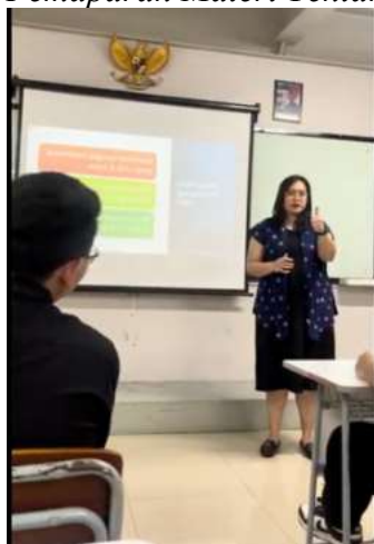
Pemaparan Materi Tentang Batik dan Filosofinya

Tahap ketiga merupakan inti dari kegiatan, yaitu workshop praktik kreatif. Dalam sesi ini, siswa diberi kesempatan untuk secara langsung menerapkan teknik pewarnaan batik pada media topi kanvas. Kegiatan ini dirancang agar peserta dapat mengekspresikan pemahaman mereka tentang nilai budaya dan isu lingkungan melalui visualisasi motif dan warna. Aktivitas ini tidak hanya mengasah keterampilan motorik dan kreativitas siswa, tetapi juga menjadi sarana internalisasi nilai-nilai simbolik yang mereka pelajari. Menurut Lave dan Wenger (1991), pembelajaran berbasis praktik dalam komunitas memungkinkan transfer pengetahuan yang lebih bermakna karena berlangsung dalam konteks sosial yang relevan. (Matsuo & Aihara, 2022).