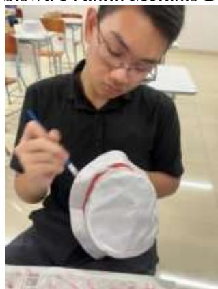
Siswa Praktik Melukis Batik Di Topi

Setelah menyelesaikan karya, siswa mengikuti tahap refleksi. Dalam sesi ini, mereka diminta untuk mempresentasikan hasil karya mereka serta menjelaskan makna di balik motif dan warna yang digunakan. Refleksi ini bertujuan untuk mengasah kemampuan komunikasi simbolik siswa, di mana mereka diajak untuk menyampaikan pesan budaya atau lingkungan secara naratif dan visual. Kegiatan ini selaras dengan model experiential-reflective learning yang diuraikan oleh Tynjälä (2008), di mana proses reflektif setelah pengalaman langsung mampu meningkatkan pemahaman mendalam dan berpikir kritis (Morris, 2020).