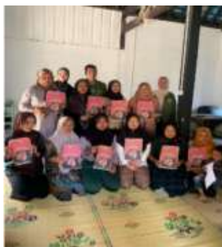
Foto bersama audience

Dengan demikian, pendekatan edukatif-partisipatif yang diterapkan dalam kegiatan ini terbukti efektif dalam meningkatkan literasi keuangan digital, membangun kesadaran kolektif, serta mendorong perubahan perilaku finansial positif pada ibu-ibu PKK Dusun Semunggang. Keberhasilan ini menunjukkan bahwa pengabdian masyarakat berbasis edukasi finansial tidak hanya berfungsi sebagai sarana peningkatan pengetahuan, tetapi juga sebagai strategi pembangunan sosial yang berkelanjutan di tingkat desa.