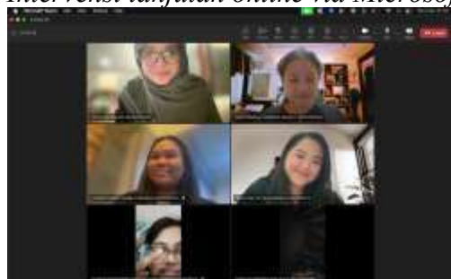
Intervensi lanjutan online via Microsoft Teams