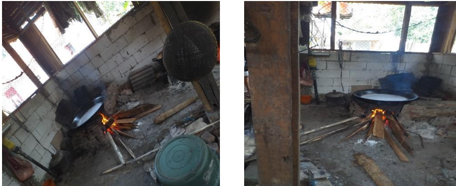
Gambar 2. Tempat Produksi Usaha Dodol

Proses produksi dodol dilakukan di rumah tempat tinggal, dibagian samping dan belakang, dibangun tempat produksi yang dilengkapi dengan alat alat yang masih sederhana dan sangat tradisional. Kondisi tempat produksi dapat dilihat pada Gambar 2.