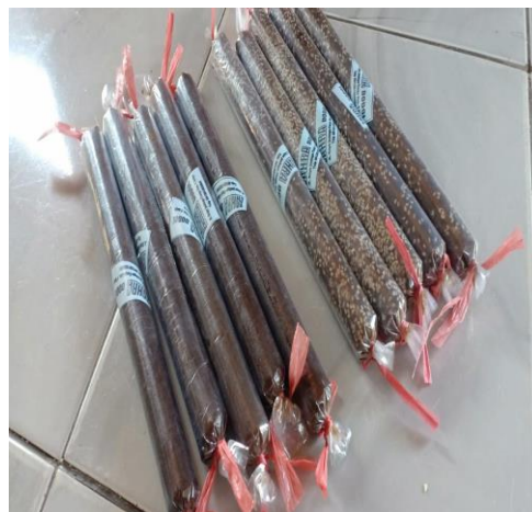
Gambar 1. Produk Dodol

Mitra yang dijadikan tempat kegiatan merupakan usaha kecil bergerak dalam bidang makanan dodol. Merupakan usaha yang baru berdiri selama kurang lebih 15 tahun. Dalam menjalankan usaha, menghadapi kendala atau kesulitan berkembang, di samping itu mereka belum menggunakan peralatan yang lebih modern dan memberikan jaminan kualitas yang lebih baik. Bagi usaha yang baru berdiri ini, masih banyaknya keterbatasan yang dimiliki mitra. Dengan modal yang terbatas, mitra sebagai pemilik usaha tidak mempunyai variasi produk yang beragam, baik dari segi ukuran, rasa maupun kemasan yang lebih baik. Selama ini produk yang dijual hanya meliputi satu macam ukuran bulat sekitar 5 cm dan memancang sekitar 110 sampai 20 cm dan produk dikemas dengan plastik biasa dengan merek menggunakan kertas cel seperti Gambar 1.