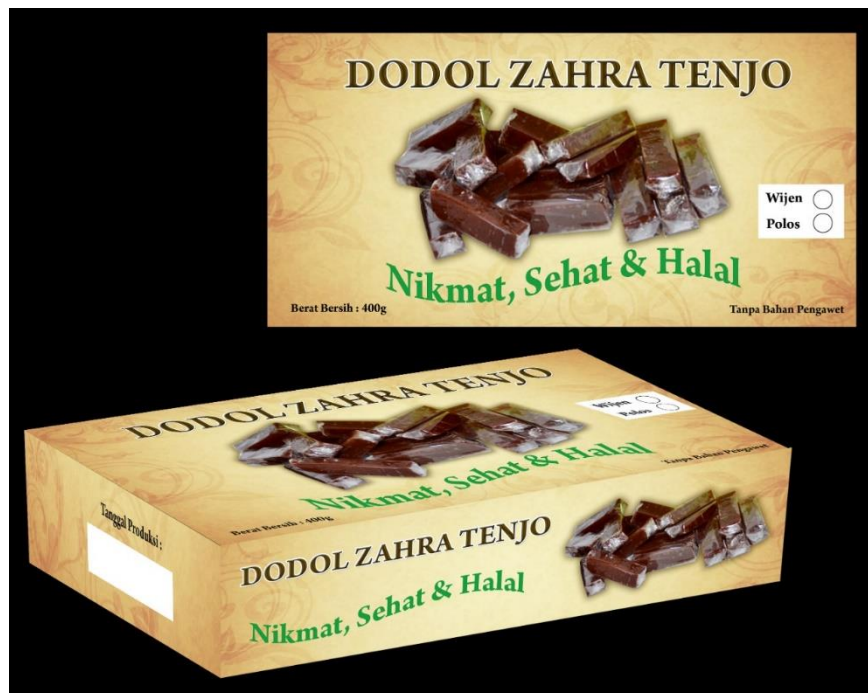
Gambar 6. Desain Kemasan Dodol Zahra

Selanjutnya dodol dibuat sesuai ukuran dus yang sudah dibuat dimasukkan dalam kemasan yang sudah di berikan ke mitra .untuk selanjutnya dodol ibu Ade siap dipasarkan. Proses penyerahan kemasan dilakukan oleh ketua Tim ke tempat mitra nampak pada Gambar 6.