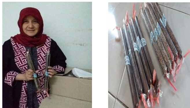
Gambar 3. Produk Dodol Yang Dihasilkan

Produk dodol yang dihasilkan meliputi dodol bulat panjang sekitar 10 cm, dibungkus dengan plastik tipis dengan dua rasa yaitu rasa original yang dibuat secara polos dan rasa yang dicampur dengan wijen. Pada saat kondisi hari hari biasa dapat memproduksi 10 sampai 30 kg. Namun pada kondisi di saat hari lebaran produksi bisa mencapai 80 sampai 120 kg. Suasana tempat produksi produk dan hasil produk yang dihasilkan terlihat pada Gambar 3.