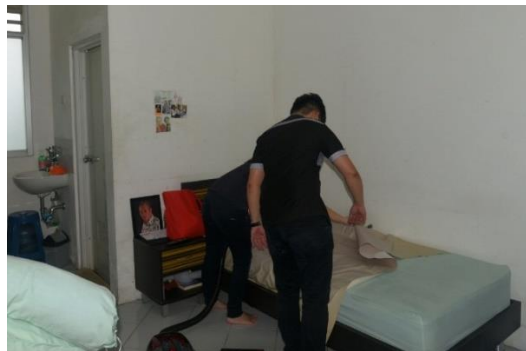
Gambar 4. Tempat Tidur, Bantal dan Guling Dirapikan Kembali