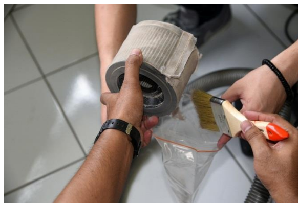
Gambar 5. Debu dari Alat Penghisap Debu Ditampung ke Dalam Plastik

Total debu yang tersedot dari 58 buah tempat tidur adalah 19,1 gram ( mean 0,33 gram). Setelah diperiksa di laboratorium Parasitologi FK Universitas Tarumanagara, TDR yang ditemukan sebanyak 144 ekor tungau ( mean 2,48).