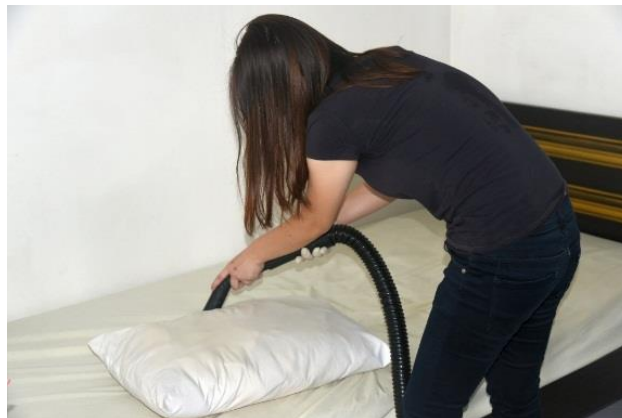
Gambar 2. Penyedotan Debu pada Bantal