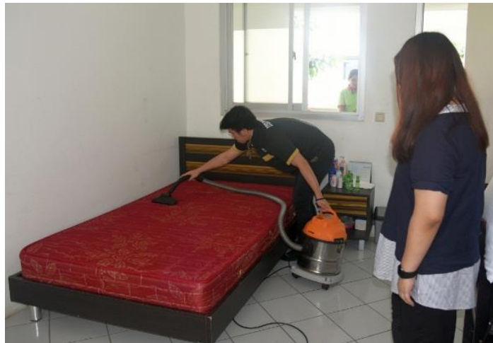
Gambar 1. Penyedotan Debu pada Kasur

Penyedotan debu dimulai dari kasur (Gambar 1), kemudian dilanjutkan dengan bantal (Gambar 2), lalu guling (Gambar 3). Sebelum disedot, sprei dan sarung bantal maupun guling dilepaskan terlebih dahulu. Selesai penyedotan, sprei berikut sarung bantal dan guling dipasang dan dirapikan kembali (Gambar 4). Debu yang telah disedot selanjutnya dibersihkan dari alat penghisap debu, dan ditampung dalam kantong plastik (Gambar 5).