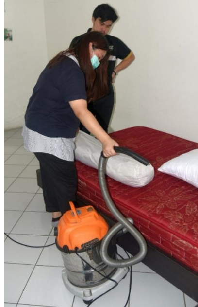
Gambar 3. Penyedotan Debu pada Guling