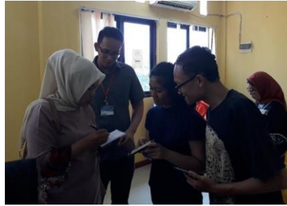
Gambar 4.3. Proses belajar menggunakan Instagram