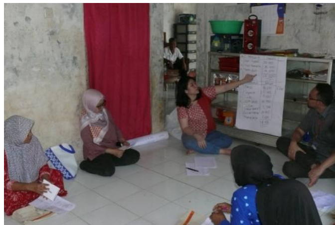
Gambar 4.1. Tutorial pencatatan keuangan

Setelah perkenalan dan tutorial, para ibu diminta melakukan praktik langsung. Tim pengabdian memberikan waktu empat belas hari kepada mereka untuk berlatih dan membiasakan diri melakukan pencatatan pengeluaran dan pemasukan uang setiap hari. Semua aliran uang harus dicatat, mulai dari uang belanja dari suami hingga bayar arisan. Setelah semua tercatat, dalam satu hari, misalnya di malam hari, semua pengeluaran dan pemasukan dihitung, kemudian dibandingkan dengan sisa uang yang masih ada. Metode ini digunakan guna membangun kesadaran para ibu tentang manfaat pencatatan keuangan. Dengan begitu, para ibu bisa mengontrol keuangan harian mereka karena mereka mengetahui dengan pasti aktivitas keuangan harian mereka.