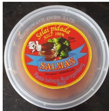
Gambar 4.7. Kemasan selai yang sudah diberi label yang baru dan lebih menarik

Begitu juga dengan desain labelnya, awalnya para ibu dipancing dengan mencoba membuat yang sederhana sambil mengajak mereka diskusi apa yang kurang dari label tersebut. Mereka menambahkan nama produk (SALMAN), lalu memberi gambar jempol. Gambar tersebut merupakan representasi dari kata “enak” atau “mantap”. Selain itu, mereka menambahkan kalimat “Selai pidada asli 100%”. Kalimat ini ingin memberi tahu kepada calon pembeli bahwa bahan baku yang digunakan benar-benar buah pidada asli dan tidak ada tambahan bahan-bahan artifisial. Kata dan logo “halal” juga ditambahkan untuk meyakinkan calon pembeli.