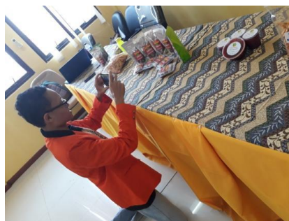
Gambar 4.2. Penataan produk dan pengambilan foto untuk diunggah ke media sosial

Tahap awal diperkenalkan bagaimana teknik mengambil foto yang menarik, mulai dari menata produk sampai sudut pengambilan foto. Produk tidak harus tertata rapi. Ada kalanya produk yang ditata dengan sengaja berantakan dapat menghasilkan foto yang menarik. Tim pengabdian juga memberikan pengarahan bagaimana sudut pengambilan foto yang seharusnya agar kemasan produk beserta informasinya dapat terlihat jelas. Para ibu yang membawa smart phone dapat langsung mempraktikkannya. Contoh-contoh produk dapat ditata lalu difoto. Hasil foto didiskusikan untuk mendapat masukan.