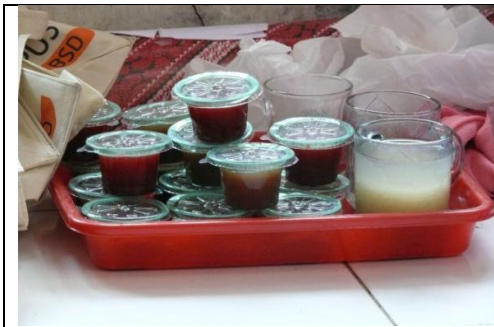
Gambar 4.5. Kemasan awal produk selai