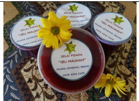
Gambar 4.6. Kemasan selai yang baru ditemplei dengan desain label yang baru

Begitu juga dengan desain labelnya, awalnya para ibu dipancing dengan mencoba membuat yang sederhana sambil mengajak mereka diskusi apa yang kurang dari label tersebut. Mereka menambahkan nama produk (SALMAN), lalu memberi gambar jempol. Gambar tersebut merupakan representasi dari kata “enak” atau “mantap”. Selain itu, mereka menambahkan kalimat “Selai pidada asli 100%”. Kalimat ini ingin memberi tahu kepada calon pembeli bahwa bahan baku yang digunakan benar-benar buah pidada asli dan tidak ada tambahan bahan-bahan artifisial. Kata dan logo “halal” juga ditambahkan untuk meyakinkan calon pembeli.