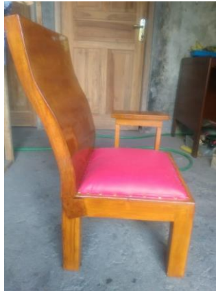
Gambar 3. Kursi Ergonomis hasil rancangan Pengabdian kepada Masyarakat

Pembuatan kursi ergonomis ini bertujuan untuk merubah posisi kerja pembatik yang sebelumnya duduk menggunakan “dingklik” diganti dengan menggunakan kursi ergonomis hasil rancangan yang diharapkan dapat menurunkan tingkat gangguan muskuloskeletal pembatik tulis. Dalam kegiatan pengabdian kepada masyarakat ini, tim pengabdian melakukan evaluasi dengan melakukan penilaian risiko ergonomi menggunakan metode Rapid Upper Limb Assessment (RULA) dan penilaian keluhan gangguan muskuloskeletal menggunakan Nordic Body Map (NBM) yang dinilai pada saat masih menggunakan “dingklik” (gambar 1) ketika membatik dan pada saat menggunakan kursi hasil rancangan pengabdian kepada masyarakat (gambar 2), dengan rentang waktu satu bulan sejak pemakaian kursi hasil rancangan.