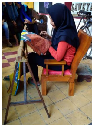
Gambar 4. Penyesuaian kursi hasil rancangan terhadap tinggi “gawangan”

Pada grand Skor RULA sebesar 3 atau diperlukan investigasi lebih lanjut (ketika menggunakan kursi hasil rancangan), maka investigasi lebih lanjut yang dimaksud dalam pengabdian kepada masyarakat ini adalah dengan memperhatikan tinggi “gawangan” (tempat meletakkan kain yang di”temboki” “malam” dengan menggunakan canting oleh pekerja) yang terlalu rendah, sehingga seperti terlihat dari kedua gambar pada tabel 1 dan tabel 2 menunjukkan bahwa sebenarnya sudah ada perbaikan tempat duduk, namun karena “gawangan” belum ditinggikan (tinggi “gawangan” awal 55 cm), maka terlihat pekerja masih bermasalah pada posisi leher karena posisi menunduk. Oleh karena itu, pengabdian menyarankan untuk meninggikan “gawangan” menjadi 75 cm, seperti tersaji pada gambar 4.