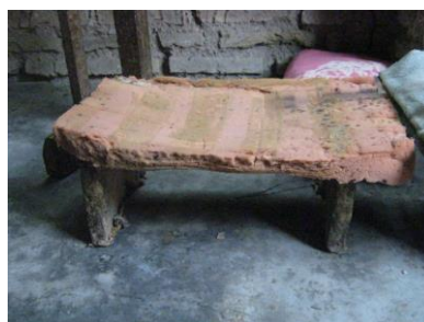
Gambar 2. “Dingklik”

Makalah ini ditulis berdasarkan hasil kegiatan pengabdian kepada masyarakat Skema IbM Program Kemitraan Masyarakat (PKM) Tahun Anggaran 2018 yang didanai berdasarkan sumber dana PNPB Universitas Sebelas Maret tahun 2018, berjudul ‘Desain “Kurgonomis” Bagi Wanita Pembatik Tulis’. Dasar pemikiran dari kegiatan pengabdian kepada masyarakat ini adalah hasil observasi posisi kerja pembatik tulis yang tidak ergonomis ketika menggunakan “dingklik” sebagai tempat duduk. Contoh gambar dingklik tersaji pada gambar 2.