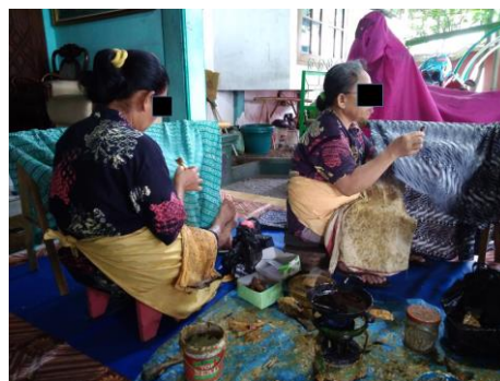
Gambar 1. Posisi kerja pembatik tulis

Kota Surakarta dikenal sebagai penghasil kain batik, yang salah satunya berasal dari kampung batik Laweyan di Surakarta. Salah satu unggulan produk kampung batik Laweyan Surakarta adalah batik tulis. Pada umumnya proses produksi batik tulis adalah persiapan (mencuci kain), membuat motif batik dengan lilin/malam, yang dilakukan dengan canting , perwarnaan; dan tahap menghilangkan lilin/malam dari kain ( melorod ). Pada saat melakukan proses membuat motif batik menggunakan canting , pekerja banyak mengabdikan waktu kerja dengan posisi duduk, seperti pada gambar 1.