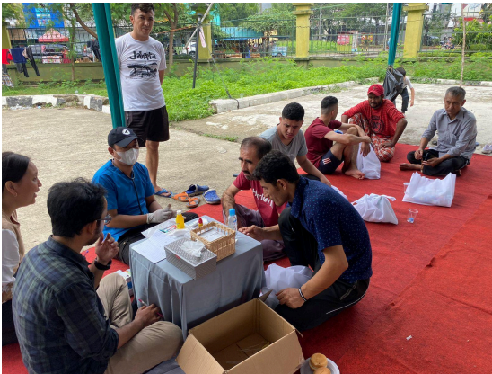
Pemeriksaan kesehatan untuk refugee