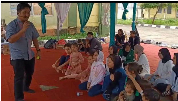
Gambar 4. Story telling untuk refugee anak