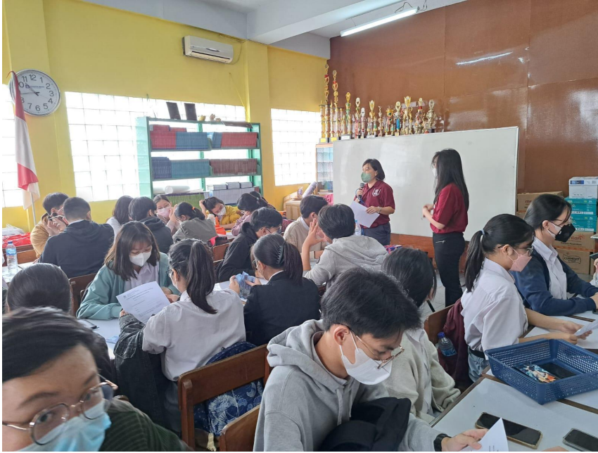
Gambar 2 Pelaksanaan Kegiatan (2)