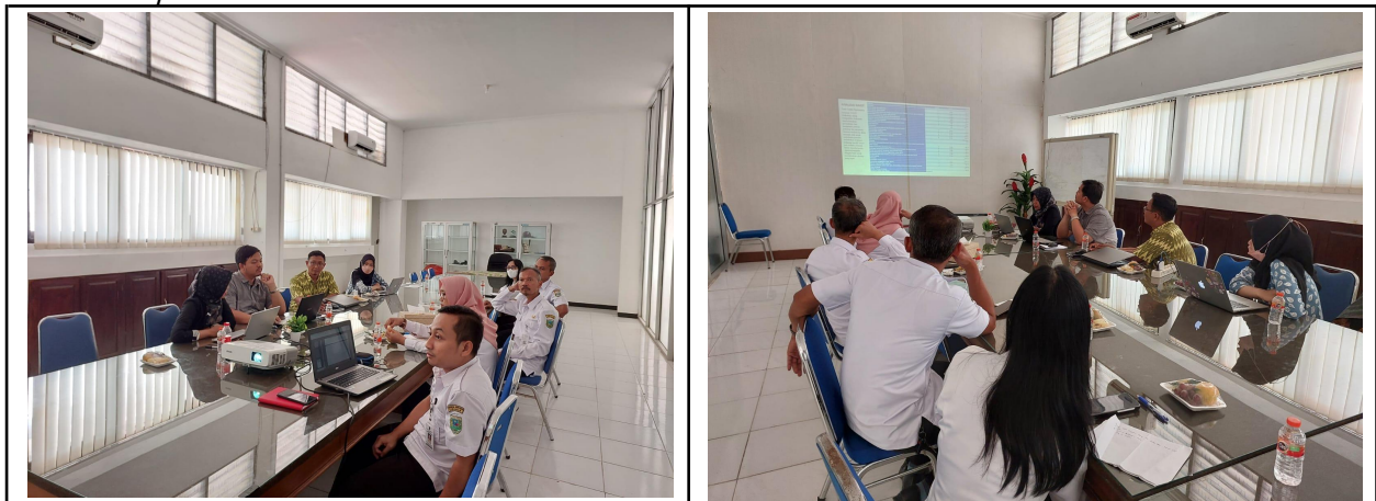
FGD Tahap Pelaksanaan