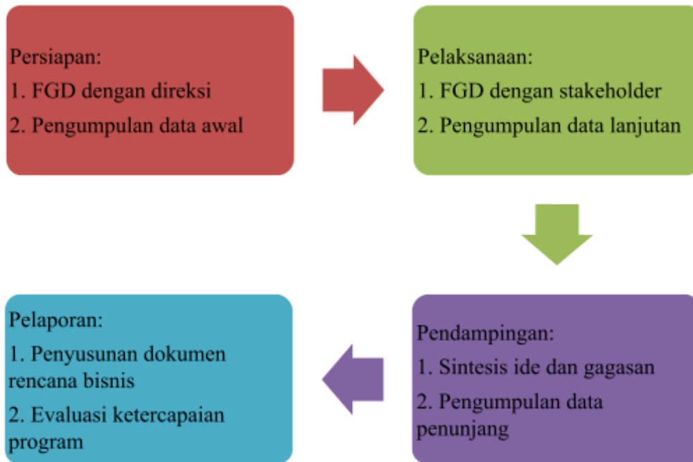
Bagan Alir Kegiatan Pengabdian kepada Masyarakat

Fase pertama meliputi tahap persiapan dan tahap pelaksanaan. Pada tahap persiapan, dilakukan kegiatan FGD antara direksi PT. Aneka Usaha Kebumen Jaya (Perseroda) dan tim ahli dari Universitas Putra Bangsa. Pada tahapan ini juga diidentifikasi data-data awal meliputi peraturan daerah dan peraturan bupati terkait dengan pelaksanaan bisnis unit bisnis perdagangan beras. Pada tahap pelaksanaan, kegiatan FGD dilakukan kembali dengan beberapa stakeholder terkait unit bisnis tersebut, yaitu dengan Kepala Bagian Perekonomian Pemda Kabupaten Kebumen, Dinas Pertanian dan Pangan Kabupaten Kebumen, dan Dinas Perindustrian, Perdagangan, Koperasi, Usaha Kecil dan Menengah Kabupaten Kebumen dapat dilihat pada Gambar 2. Kegiatan ini berusaha untuk menjawab proses bisnis apa saja yang harus dijalankan oleh unit usaha perdagangan beras dan kesiapan sumber daya yang dimiliki oleh pemerintah daerah. Oleh karena itu, pada tahap pelaksanaan, beberapa data lanjutan juga dikumpulkan untuk analisis dalam penyusunan dokumen rencana bisnis.