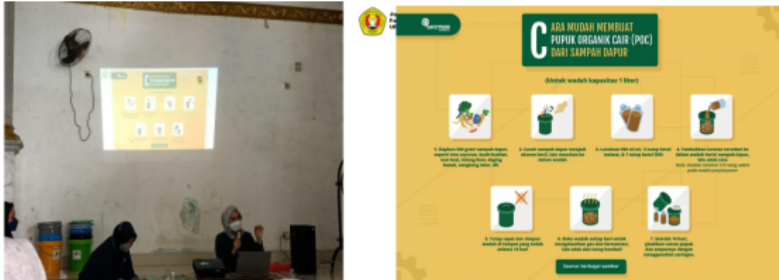
Penyuluhan dan pelatihan produksi POC dengan bahan sampah rumah tangga