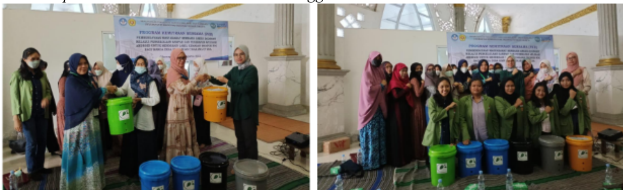
Pelatihan produksi POC dari limbah rumah tangga