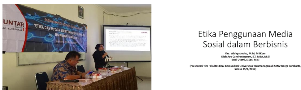
Gambar 4. Pemberian materi dan contoh materi yang disampaikan oleh Ibu Budi Utami, SS., M.Si dalam Kegiatan Pengabdian Masyarakat oleh Tim Fikom Untar 25-26 April 2017

Peserta yang merupakan siswa/siswi yang sama dengan hari sebelumnya, mendengarkan dengan antusiasme tinggi. Beberapa di antara mereka banyak yang mengajukan pertanyaan atau sekedar berbagi pengalaman dalam kegiatan bisnis online, baik sebagai penjual maupun pembeli.