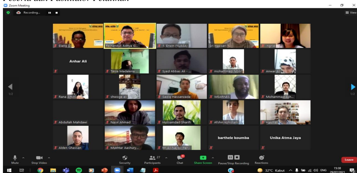
Peserta dan Fasilitator Pelatihan