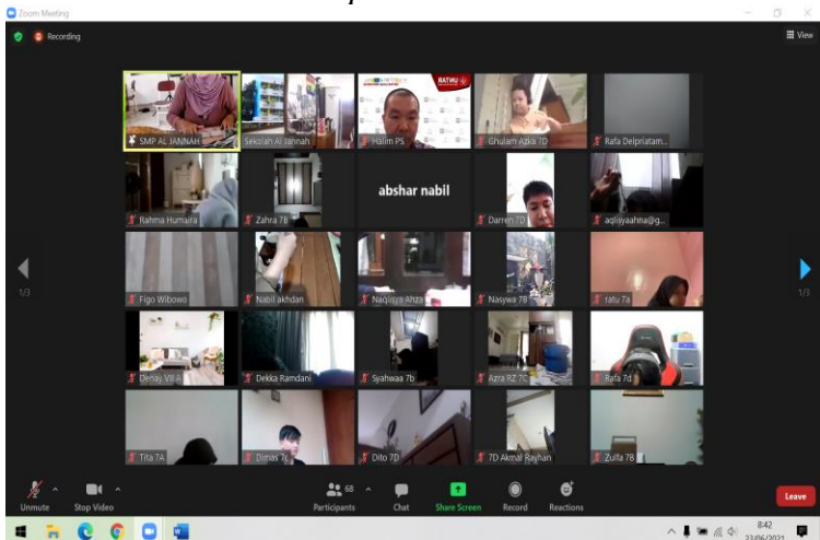
Situasi Peserta Workshop Online