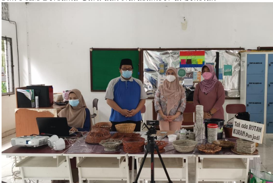
Tim PKM Bersama Guru dan Narasumber di Sekolah

Situasi kegiatan pada Gambar 1 menampilkan tim PKM bersama guru dan narasumber yang menyelenggarakan kegiatan di sekolah. Pada gambar tersebut dapat dilihat bahwa guru sedang