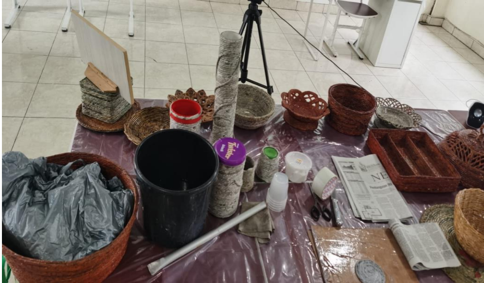
Bahan Workshop dan Contoh Produk Kerajinan Kertas Koran