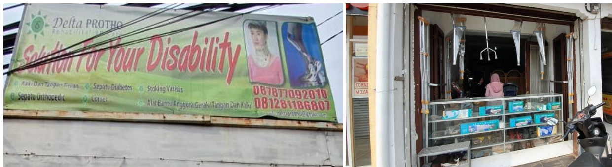
Gambar 2. UKM Mitra kegiatan PKM

Pada kegiatan pengabdian pada masyarakat ini, telah disepakati dengan mitra bahwa akan dicari solusi terhadap permasalahan yaitu mengganti bahan baku dengan mengimplementasikan teknologi manufaktur pembuatan socket prosthesis menggunakan bahan komposit serat bambu dan matriks epoksi ke UMKM yang bergerak di bidang pembuatan dan pemasaran produk prosthesis . Kegiatan yang akan dilaksanakan meliputi pelatihan pembuatan socket prosthesis dengan menggunakan bahan komposit serat bambu epoksi dan diimplementasikan ke pasien yang membutuhkan. Tim PKM Universitas Tarumanagara melalui penelitian Hibah Bersaing dan Hibah Unggulan Perguruan Tinggi, telah berhasil melaksanakan penelitian bahan komposit serat bambu sebagai bahan socket prosthesis dengan yang baik.