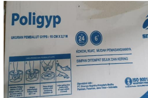
Gambar 5. Pembuatan cetakan

Proses pembuatan soket dengan bahan komposit serat bambu, mengikuti semua langkah kerja yang telah diuraikan dalam teknologi tempat guna pembuatan soket, dan dilatihkan kepada UKM Mitra, dan hasil proses produksi soket telah digunakan dengan baik oleh responden. Berikut beberapa dokumen kegiatan finalisasi kegiatan PKM ini, bersama semua tim pelaksana kegiatan PKM dan juga dengan UKM Mitra dan responden yang menggunakan kaki palsu hasil produksi Bersama dengan UKM Mitra.