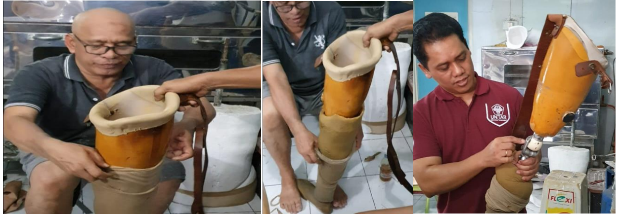
Gambar 6. Proses finalisasi pembuatan kaki palsu

Hasil pembuatan soket kaki palsu selanjutnya digunakan oleh responden dalam kegiatan PKM ini. Produk kaki palsu yang telah dihasilkan dengan menggunakan teknologi tepat guna yang diperoleh dari hibah penelitian Dikti, dapat digunakan dengan baik oleh responden. Responden merasakan kenyamanan menggunakan kaki palsu, dimana soket dibuat dengan menggunakan bahan komposit serat bambu kontinyu. Semua teknologi pembuatan soket dengan menggunakan bahan komposit serat bambu telah dilatihkan kepada UKM Mitra dengan hasil yang baik.