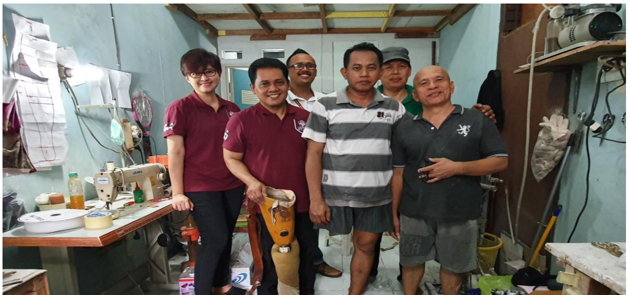
Gambar 7. Kegiatan uji coba kaki palsu di UKM Mitra

Hasil pembuatan soket kaki palsu selanjutnya digunakan oleh responden dalam kegiatan PKM ini. Produk kaki palsu yang telah dihasilkan dengan menggunakan teknologi tepat guna yang diperoleh dari hibah penelitian Dikti, dapat digunakan dengan baik oleh responden. Responden merasakan kenyamanan menggunakan kaki palsu, dimana soket dibuat dengan menggunakan bahan komposit serat bambu kontinyu. Semua teknologi pembuatan soket dengan menggunakan bahan komposit serat bambu telah dilatihkan kepada UKM Mitra dengan hasil yang baik.