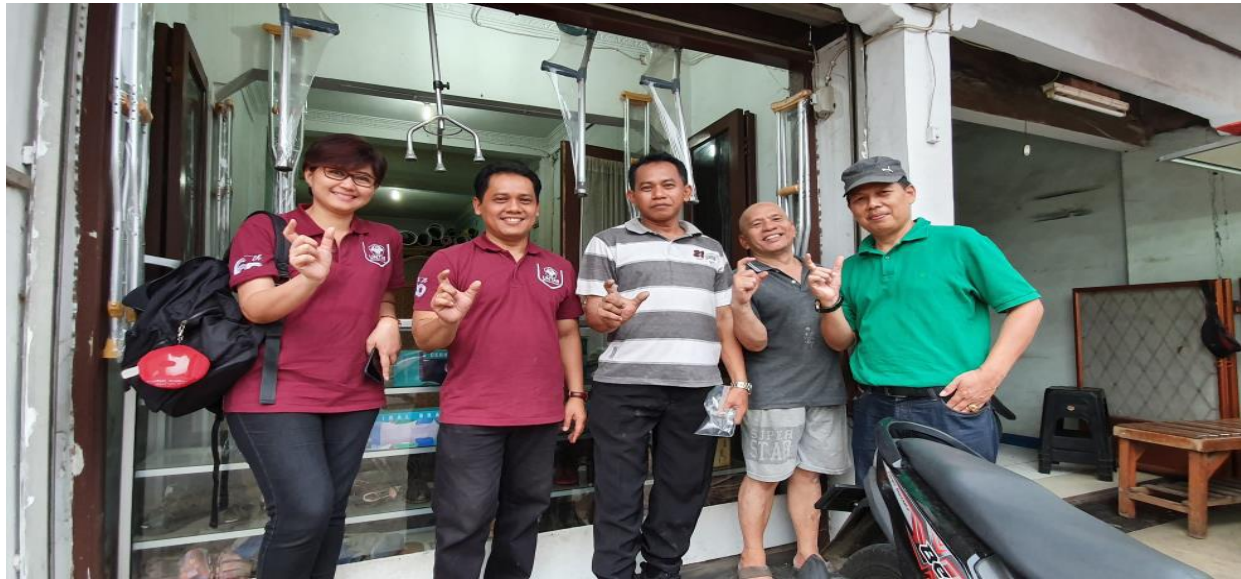
Gambar 8. Tim PKM telah menyelesaikan kegiatan di UKM Mitra