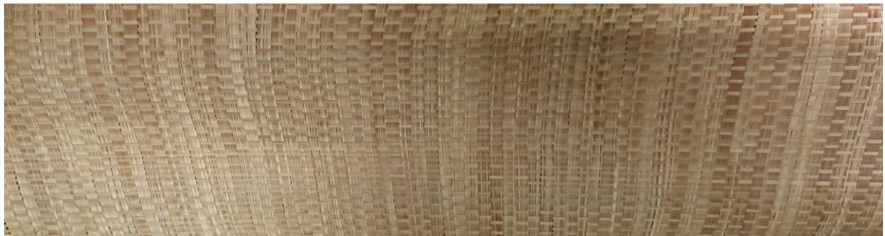
Gambar 3. Anyaman serat bambu

Persiapan serat bambu dilakukan dengan menyiapkan serat bambu kontinyu kemudian dibuat dalam bentuk anyaman dengan ukuran 50cm x 50 cm seperti gambar berikut: