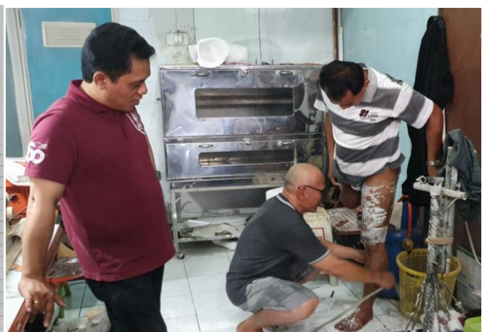
Gambar 4. Pengukuran data antropometri responden