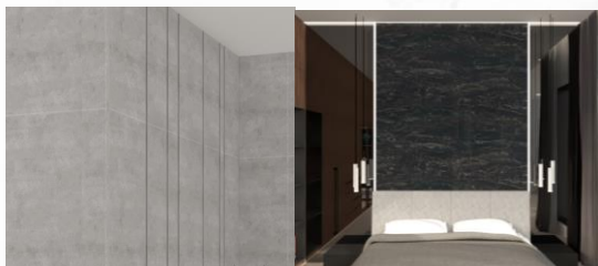
Gambar 2: Dinding Kamar Tidur Anak

Penerapan gaya industrial kurang terlihat pada bagian plafon, karena kurang adanya hal spesifik yang secara khusus mencirikan gaya industrial. Plafon kamar tidur anak ini menggunakan gypsum yang hanya dicat warna putih.