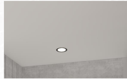
Gambar 3: Plafon Kamar Tidur Anak (sumber: Dokumentasi Pribadi, 2021)

Penerapan gaya industrial kurang terlihat pada bagian plafon, karena kurang adanya hal spesifik yang secara khusus mencirikan gaya industrial. Plafon kamar tidur anak ini menggunakan gypsum yang hanya dicat warna putih.