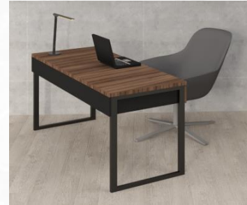
Gambar 7: Meja dan Kursi Kerja

Furniture di kamar ini juga ada yang menggunakan bahan kulit, yaitu pada bagian belakang kursi kerja dan armchair serta tempat tidur. Bagian depan atau dudukan kursi kerja dan armchair ditutupi dengan kain, sementara kaki kursi menggunakan material metal.