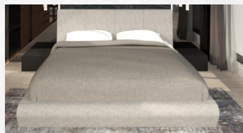
Gambar 9: Tempat Tidur