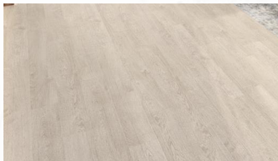
Gambar 1: Lantai Kamar Tidur Anak

Penerapan karakteristik gaya industrial pada elemen interior kamar tidur anak ini sudah cukup terlihat, terutama pada lantai dan dinding. Lantai kamar ini seluruhnya menggunakan parket kayu, dan hampir seluruh dinding ruangan ini menggunakan cat tekstur semen ekspos, bagian yang tidak menggunakan cat tekstur semen ekspos ini berada pada backdrop tempat tidur, dinding bagian ini menggunakan cermin warna hitam pada kedua sisi dan bagian tengah menggunakan marmer cosmic black .