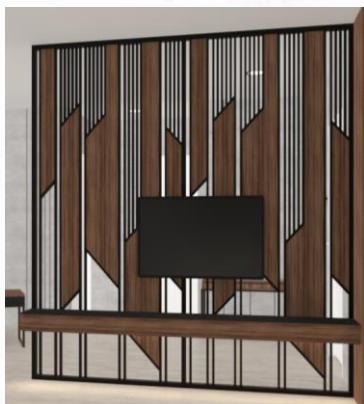
Gambar 5: Backdrop TV