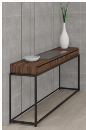
Gambar 6: Meja Console