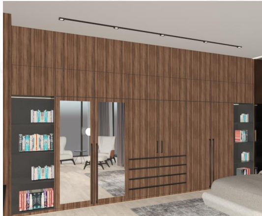
Gambar 4: Lemari Pakaian

pakaian, backdrop TV, meja console dan meja belajar. Material metal berwarna hitam digunakan sebagai struktur pada backdrop TV, meja console serta meja belajar, dan pada handle pintu lemari pakaian.