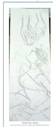
Gambar 1: Sketsa Kisah Sari Bulan

Dalam proses pengaplikasian, memiliki permasalahan yaitu style ilustrator yang tidak sesuai dengan tema cerita cerita dongeng Indonesia. Style ilustrasi lebih condong ke gaya komik Jepang dan tidak mengandung tampilan fisik orang Indonesia untuk provinsi tertentu..