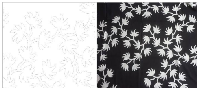
Gambar 8: Batik Motif Lencor

Penulis mencoba mencari referensi batik lain yang terlihat lebih sederhana agar hasil ilustrasi akhir tidak terlalu ramai.