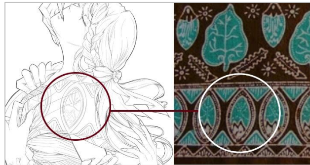
Gambar 6: Motif Batik menjadi Atribut Karakter

Untuk mencapai hasil yang cocok, penulis tidak melakukan percobaan ini sekali. Untuk ilustrasi Jaka Tarub dan Nawang Wulan, ada pergantian motif batik. Motif batik yang dipilih pertama kali adalah batik Gedhog Kembang Waluh dari Jawa Timur yang terlihat terlalu detail sehingga dikhawatirkan akan sulit untuk diwarnai.