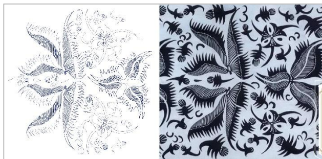
Gambar 7: Motif Batik Gedhog Kembang Waluh

Untuk mencapai hasil yang cocok, penulis tidak melakukan percobaan ini sekali. Untuk ilustrasi Jaka Tarub dan Nawang Wulan, ada pergantian motif batik. Motif batik yang dipilih pertama kali adalah batik Gedhog Kembang Waluh dari Jawa Timur yang terlihat terlalu detail sehingga dikhawatirkan akan sulit untuk diwarnai.