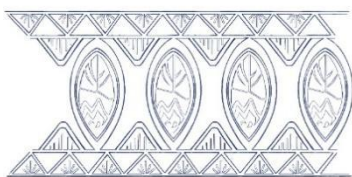
Gambar 5: Motif Batik Daun Sirih Digital

Motif batik Daun Sirih dibuat kembali dalam versi digital agar dapat disesuaikan dengan lineart karakter. Hanya sebagian motif batik yang dibuat dalam bentuk digital karena pertimbangan akan menjadi terlalu detail bila dibuat keseluruhan motifnya. Setelah menjadikannya sketsa digital, motif batik di komposisikan untuk diletakkan di karakternya.