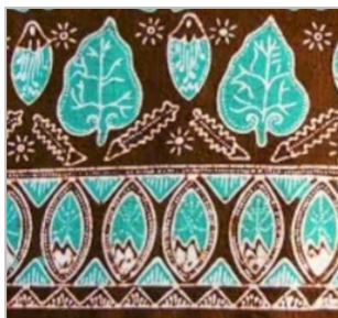
Gambar 4: Motif Batik Daun Sirih

Motif batik Daun Sirih dibuat kembali dalam versi digital agar dapat disesuaikan dengan lineart karakter. Hanya sebagian motif batik yang dibuat dalam bentuk digital karena pertimbangan akan menjadi terlalu detail bila dibuat keseluruhan motifnya. Setelah menjadikannya sketsa digital, motif batik di komposisikan untuk diletakkan di karakternya.